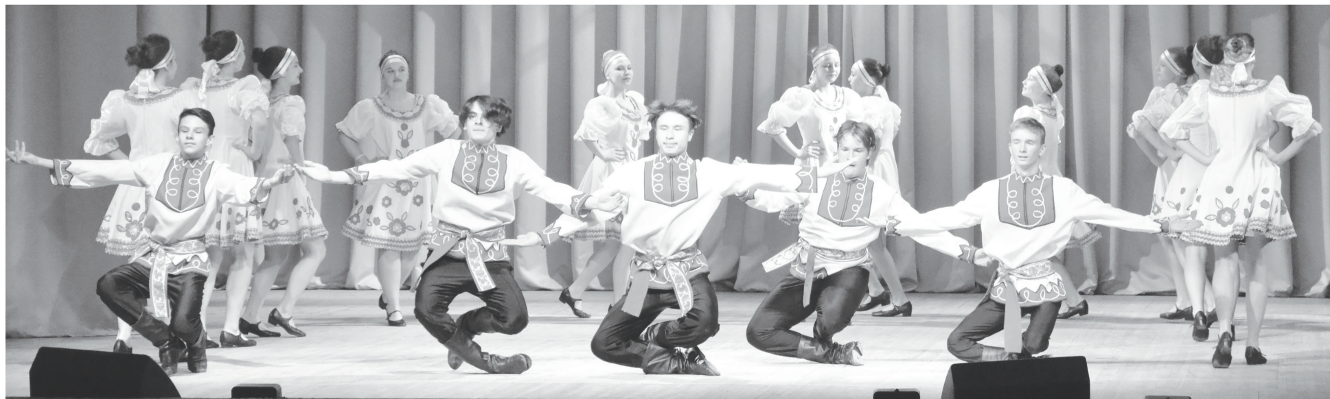
На сцене ансамбль народного танца «Радуга» Упоровской ДШИ.