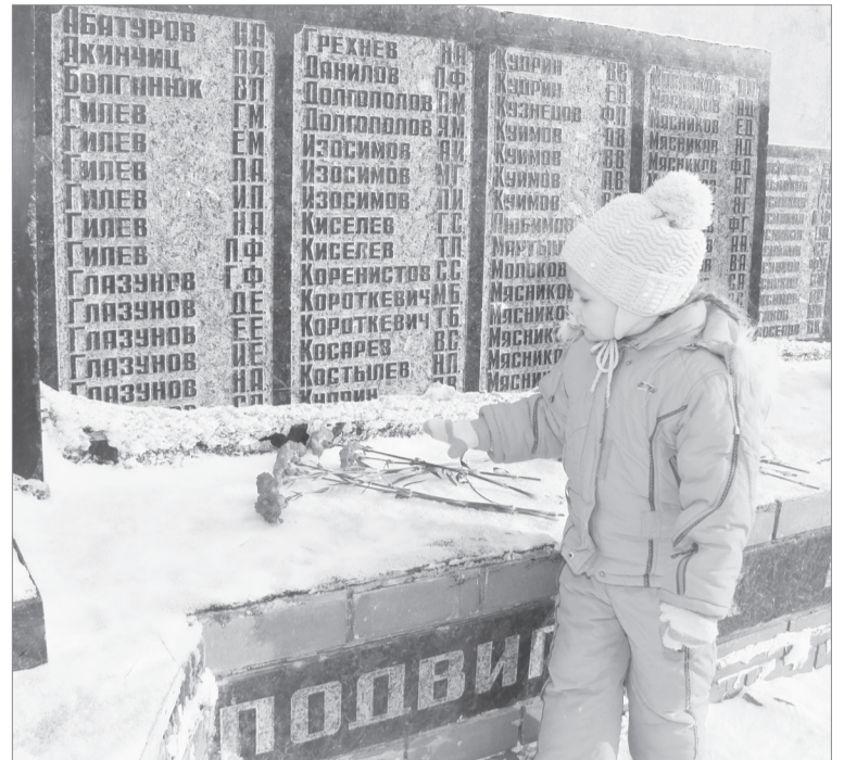
Гвоздики от правнучки

когда-то и деревенька Гилева, которая позднее соединилась с селом Хохлово.