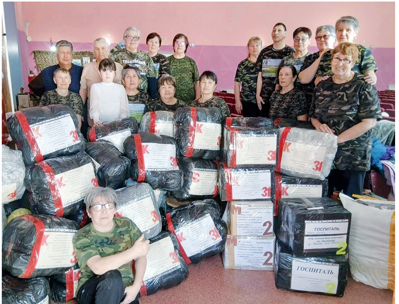
► Абак. За своих мужчин стоим горой!