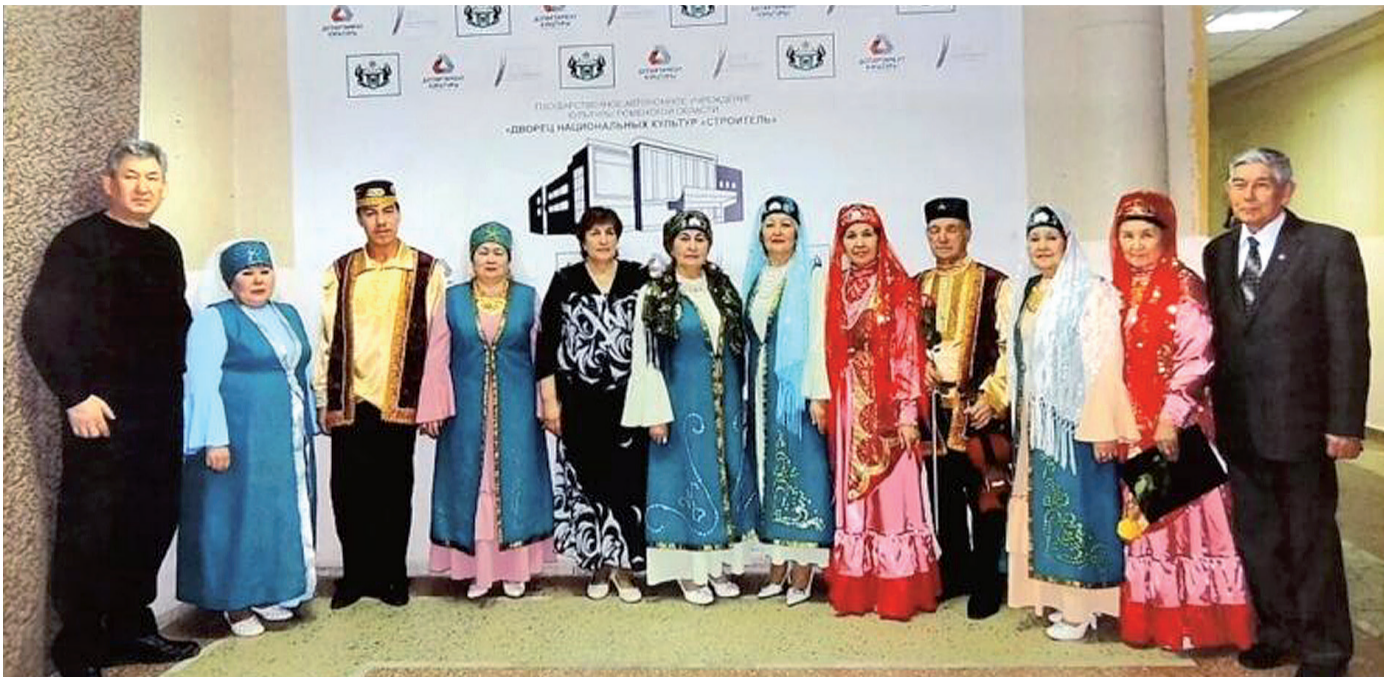
► В коллективе пели педагоги, преподаватели и представители других профессий