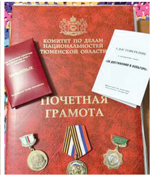
► Награды за верность песне и культуре