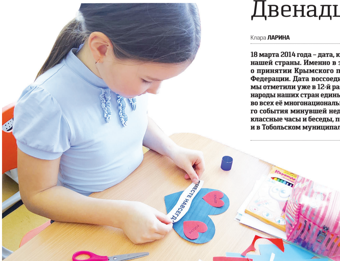
Фото Дегтярёвской школы

А в Дегтярёвском ДК участниками мероприятия стали взрослые – волонтеры, активисты патриотического движения. Говорили о Крыме, той земле, что стала символом мужества и единства. Виртуальное путешествие, которое совершили участники, помогло увидеть и познакомиться со знаменитыми местами и уголками полуострова. Но главное – говорили о людях, о том самом референдуме, который изменил судьбу тысяч граждан Крыма, и что значит быть вместе. Во время встречи звучали искренние слова, стихи о Родине, и, конечно, о том, что история пишется сегодня и зависит от каждого из нас!