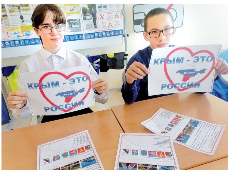
Фото Овсянниковской школы