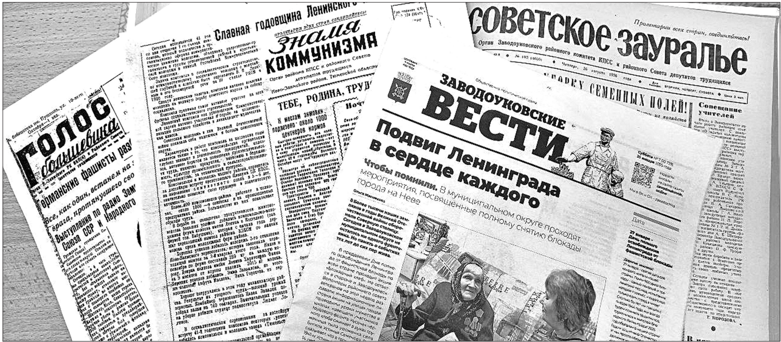
К сожалению, в архиве редакции газеты «Заводоуковские вести» ни одного экземпляра «Сталинского пути» нет.

Истории строки. Год 2025-й – юбилейный для районной газеты «Заводоуковские вести». Ей исполняется 90 лет!