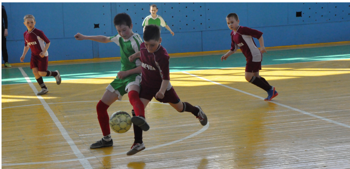
На футбольной площадке — команды «Спарта» и «Мечта».