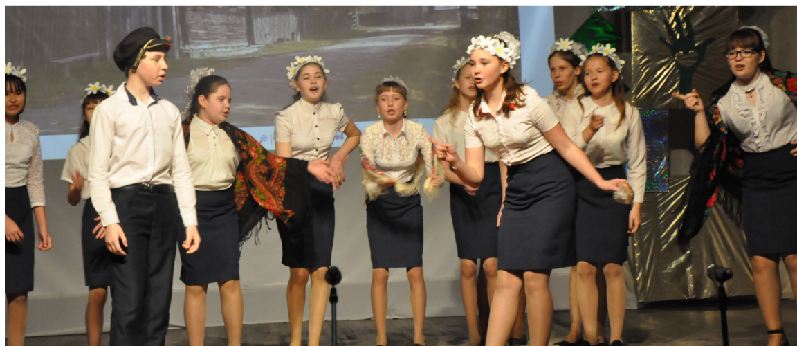
Лауреат первой степени муниципального этапа Всероссийского фестиваля школьных хоров «Пюют дети России» – хор «Радуга» из Шорохово.