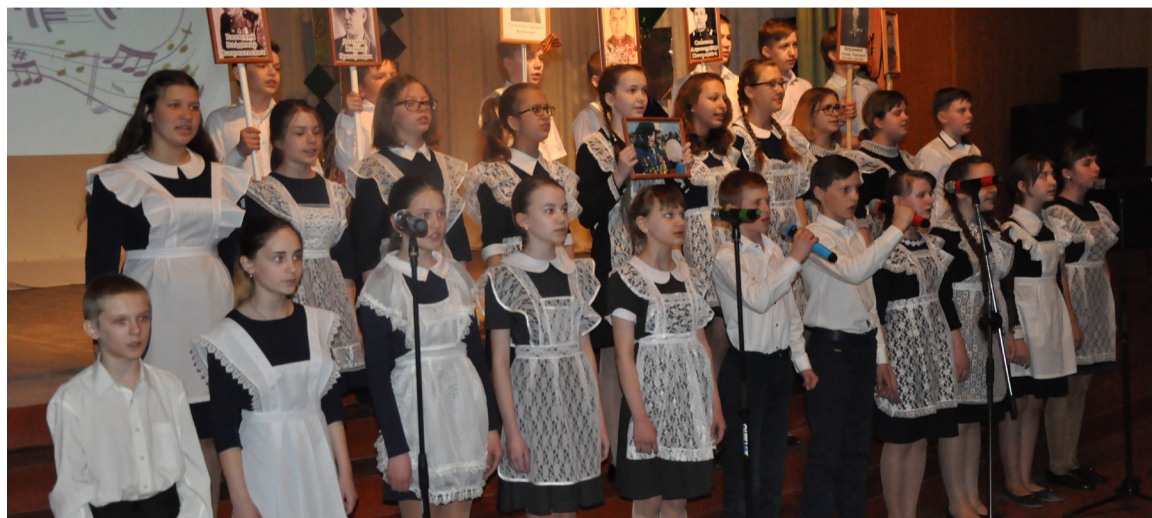
Сводный хор шестых классов ИСШ № 2 исполнил песню «Я хочу, чтобы не было больше войны».

Итак, пришла пора подвести итоги. Диплом лауреата первой степени муниципального этапа Всероссийского фестиваля школьных хоров «Пюют дети России» стал хор «Радуга» из Шорохово. В номинации «За верность песне» районного фестиваля «Самая поющая школа» награждены учащиеся пятых классов исетской школы № 2 и «Весёлые нотки» из Рафайлово. В номинации «Удачный дебют» поощрены «Дружные ребята» из Бобылево. Лауреатом третьей степени стал хоровой коллектив «Звонкая капель» исетской школы № 1, лауреатом второй степени признан коллектив «Вдохновение» архангельской школы. А победу в конкурсе «Самая поющая школа» праздновали шестиклассники исетской школы № 2.