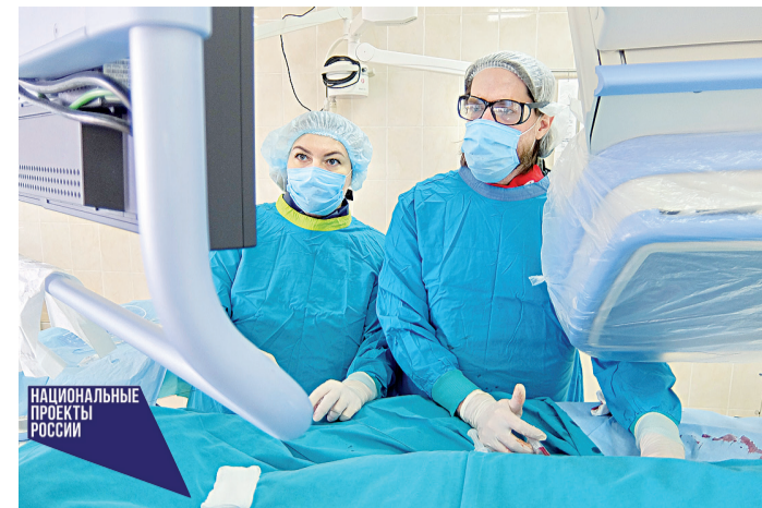
НАЦИОНАЛЬНЫЕ ПРОЕКТЫ РОССИИ