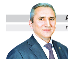
АЛЕКСАНДР МООР губернатор Тюменской области

Уважаемые работники и ветераны учреждений культуры Тюменской области!