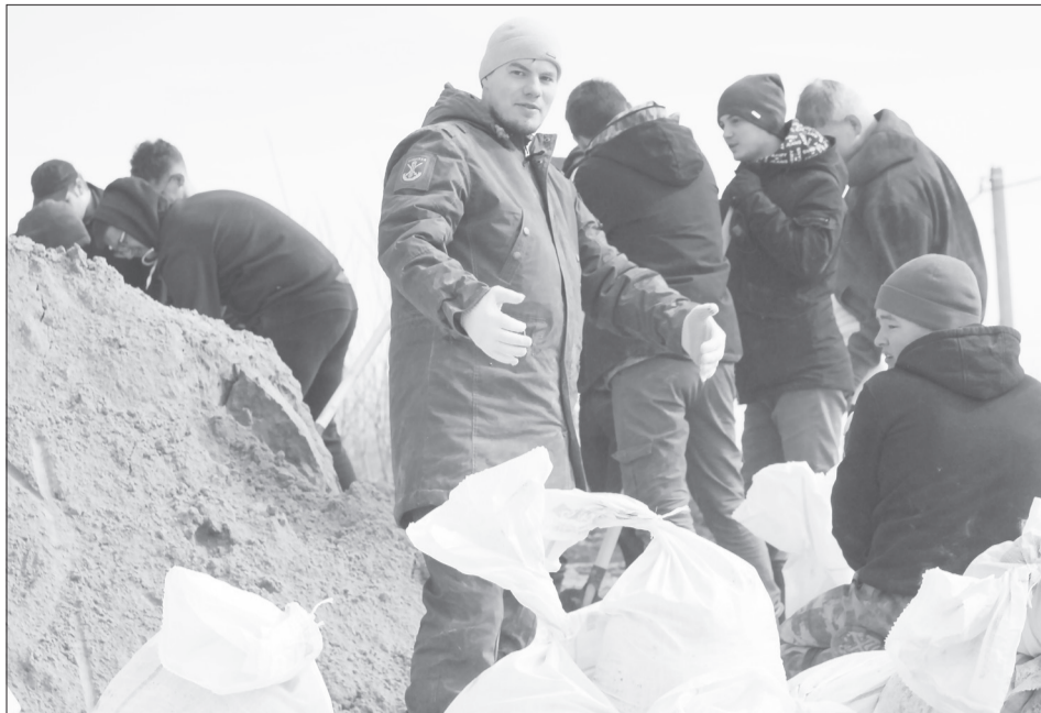
В Ялуторовске волонтерами часто выступают студенты агротехнологического колледжа из числа местных ребят