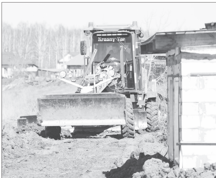
Технике в Ревде местами приходилось пробираться вплотную к домам на берегу старицы Тобола