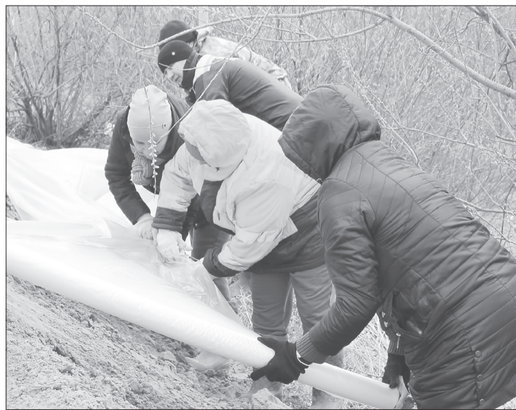
В Памятном местные жители помогают укреплять противопаводковую защиту, желающих приглашают через социальные сети