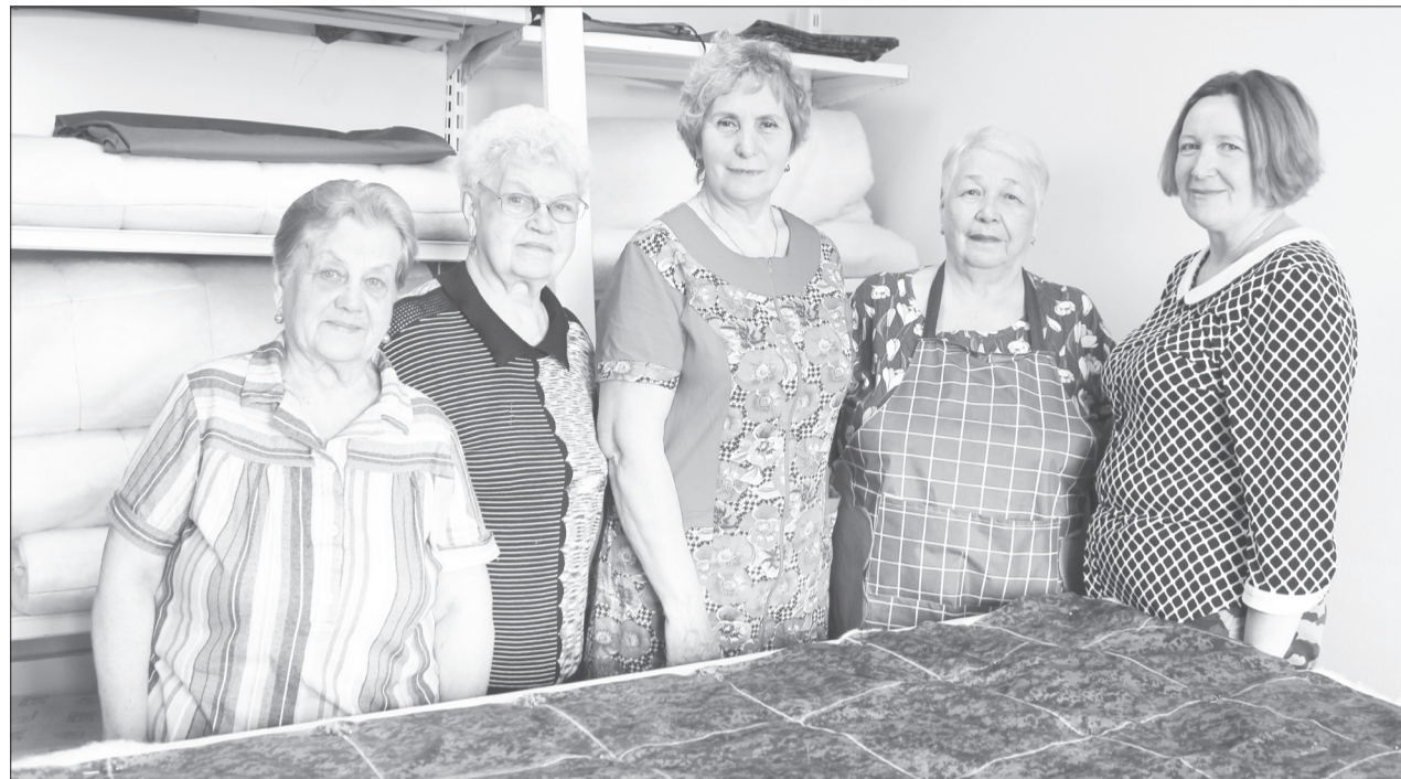
Если работы много, доброшвей встречаются ежедневно

По запросам. Особая гордость мастериц - плащ-палатка, разработанная совместно с участником СВО. Женщины учили все требования к многофункциональному предмету: размеры, материал, количество и расположение петель.