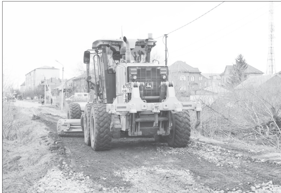
Этим проездом по грунтовке к Тоболу пользовались рыбаки. Такой возможности в ближайшее время у них не будет