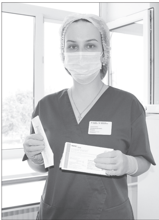
В ОБ № 23 прививают двумя видами вакцин - «Флю-М» и «Совигрипп»

Куда идти. В холле на первом этаже ОБ № 23 установлен баннер с подробной инструкцией для тех, кто желает поставить прививку. Сначала в терминале нужно взять талон электронной очереди на вакцинацию, подняться на второй этаж в кабинет № 220 и пройти осмотр у врача или фельдшера. Они работают по будням с 8-00 до 16-18 с обеденным перерывом с 12-30 до 13-00. Там вы получите направление в соседний процедурный кабинет № 202, где медсестра сделает вам прививку. Всё это бесплатно по полису ОМС. Для жителей сельской местности последовательность действий проще: нужно просто прийти в свой ФАП, там тоже есть вакцины от гриппа. Кроме того, возможна организованная прививочная кампания с выездом на предприятия и в учреждения.