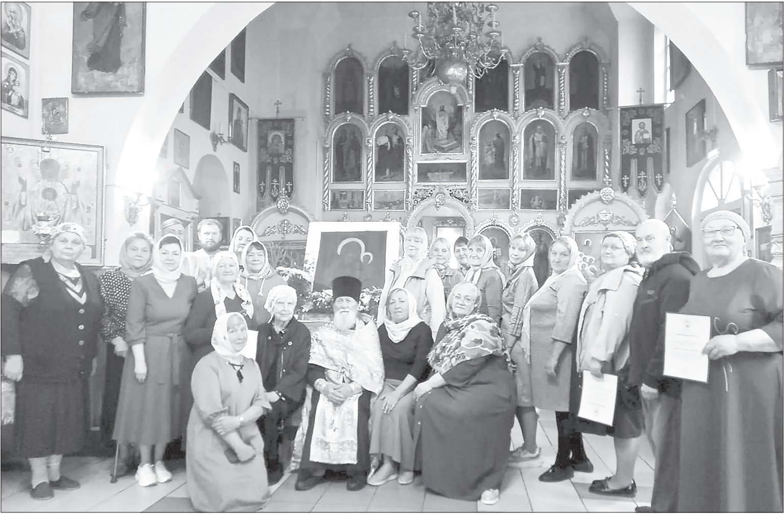
Жёны и матери собираются на молитву в храме по пятницам