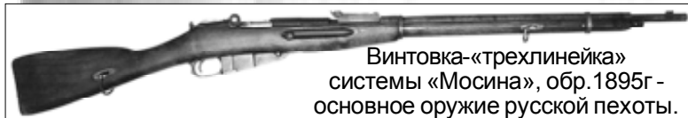
Винтовка «трехлинейка» системы «Мосина», обр. 1895 г - основное оружие русской пехоты.