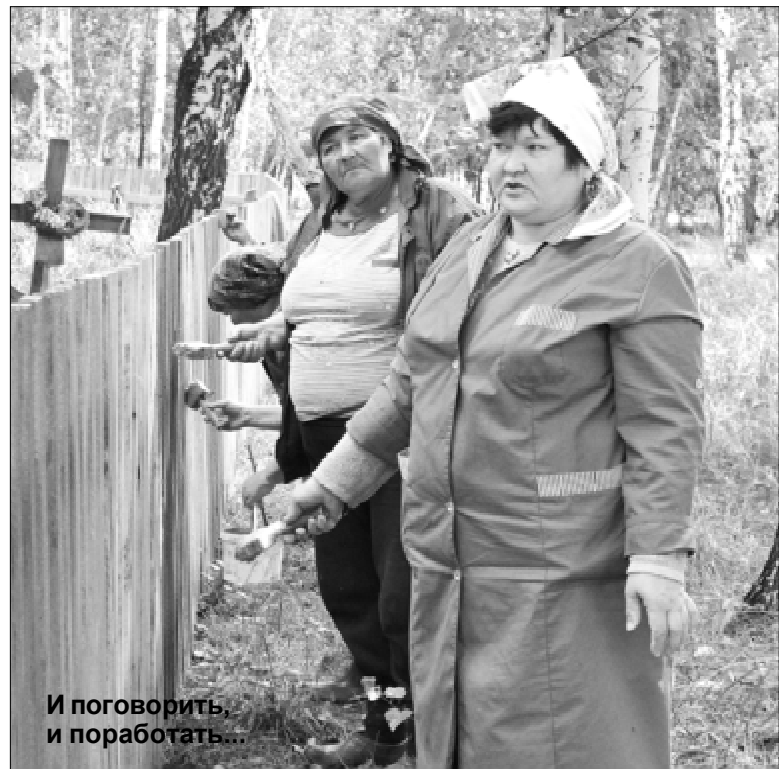
И поговорить, и поработать...