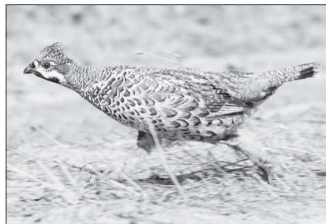
Этот рябчик словно бросает на ходу: «Не до вас, спешу!». На самом деле лесные петухи очень пугливые, убегают так, что только лапки сверкают!