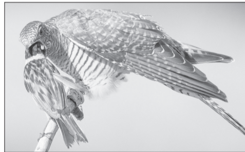
Камышовая овсянка продолжает преданно выкармливать кукушонка, хотя птенчик уже в два раза перерос свою кормилицу