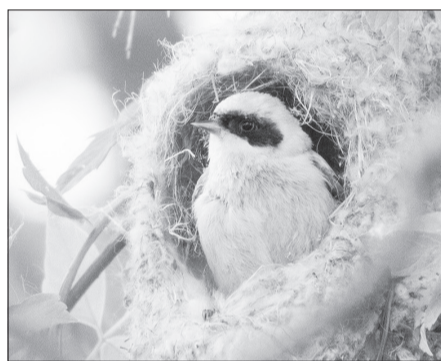
А в этой тёплой и уютной varejke из пуха рогоза спрятался ремез. Певчая птичка живёт по берегам рек и водоёмов