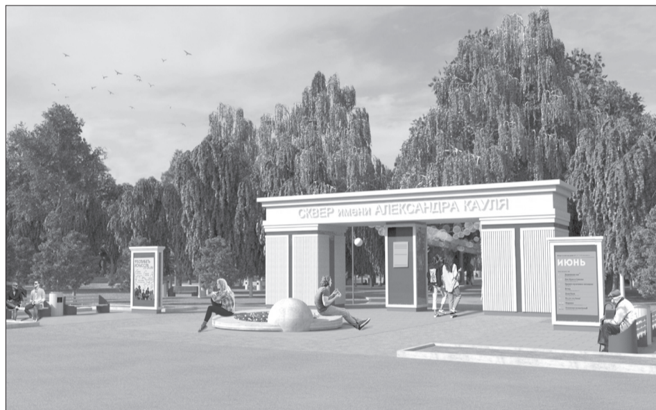
Так может выглядеть центральный вход

- До первого мая нам необходимо подготовить заявку и отправить её в областной де-