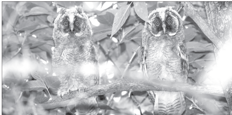
Маленькие ушастые совы фотографируются строго и прямо как на паспорт

КСТАТИ. Люди, которые выбираются на природу, чтобы просто полюбоваться птицами, называются бёрдвотчерами.