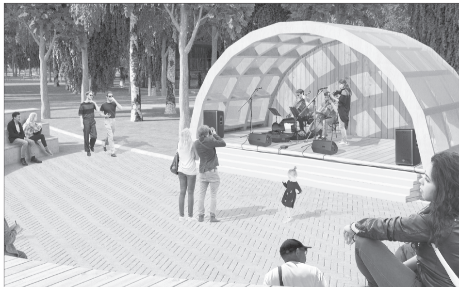
Пожелания горожан о летней сцене в парке учтены

■ В 1958 году парк назывался в честь 40-летия ВЛКСМ