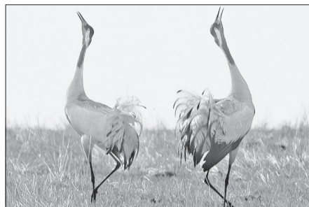
Кружась в «свадебном» танце, журавли щёлкают клювами и запрокидывают головы назад