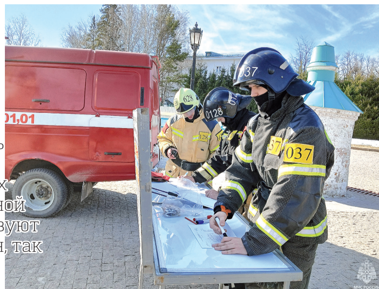
► Праздники должны быть безопасными.

По информации 8 пожарно-спасательного отряда