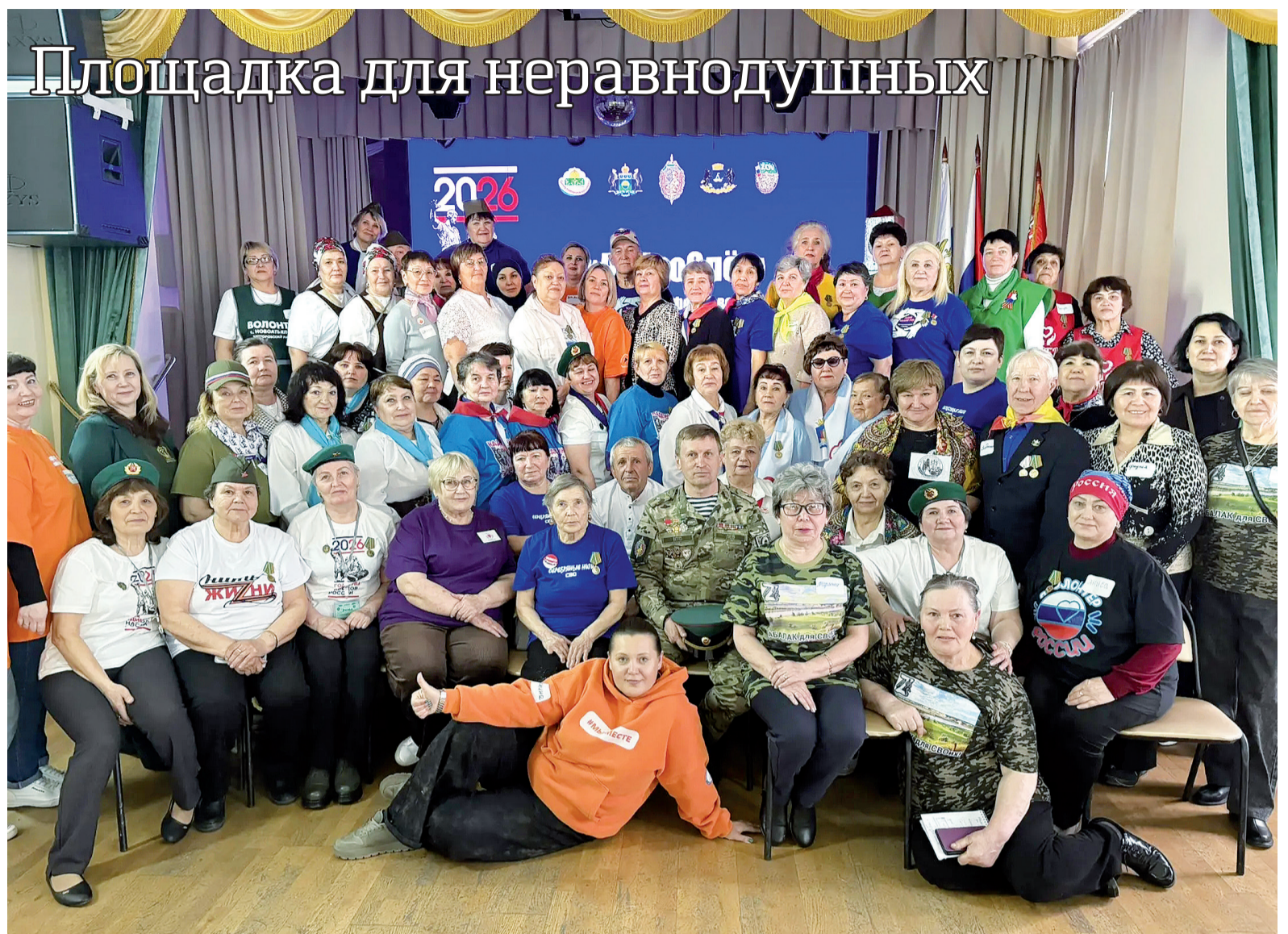
► Девять команд из Тобольского округа на «Доброслёте»

Тобольский муниципальный округ на слёте представляли девять волонтерских объединений: «Серебряные нити СВО» из Ворогушино, «Абалак для СВОих», «Всё для Победы» из Бизино, «Свеча» из Кутарбитки, «Надежда» из Булашово, «Зелёные паучки» из Байкалово, «Надёжный тыл» из Ермаково. Слёт стал площадкой, объединившей неравнодушных людей, чьё сердце всегда открыто для помощи ближним, ведь собрались здесь те, кто ежедневно творит добро: плетёт сети, заливает свечи,