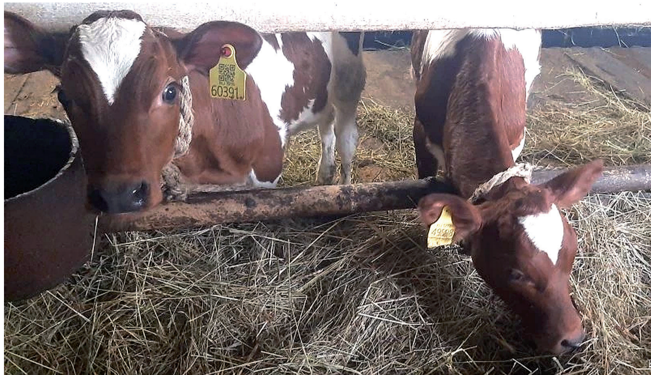
► Скот здоров и накормлен – а это главное.