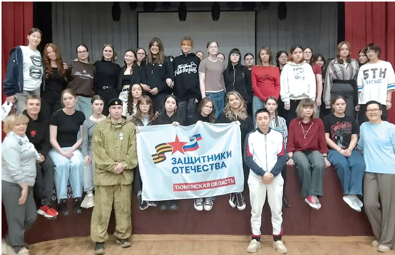
► Урок неравнодушия