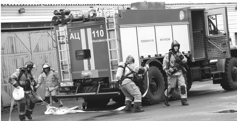
Под вой сирен в ДРСУ-4 прибыла пожарная машина, не теряя времени, огнеборцы ринулись тушить условный пожар

Непроглядная пелена дыма заволокла ремонтный гараж Голышмановского участка ДРСУ-4.