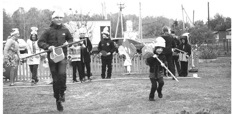
Подвижные игры и весёлые эстафеты привлекли много детворы

Наталья ГЛАДКОВСКАЯ