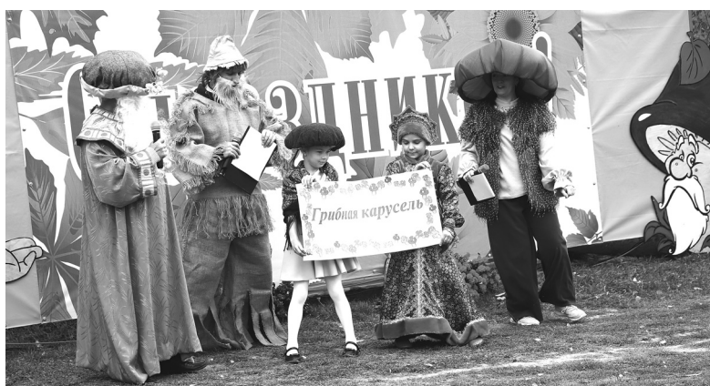
В праздничный день грибы можно было встретить даже в центре села Медведево – многие пришли в костюмах дикоросов

Особенно на Руси и в Российской империи ценились солёные ароматные грузди и пахнущие свежей хвоей рыжики. Очень популярны были пироги с ними. Ещё из солёных грибов варили супы и часто добавляли их в щи. Такие блюда ели в скоромные и постные дни.