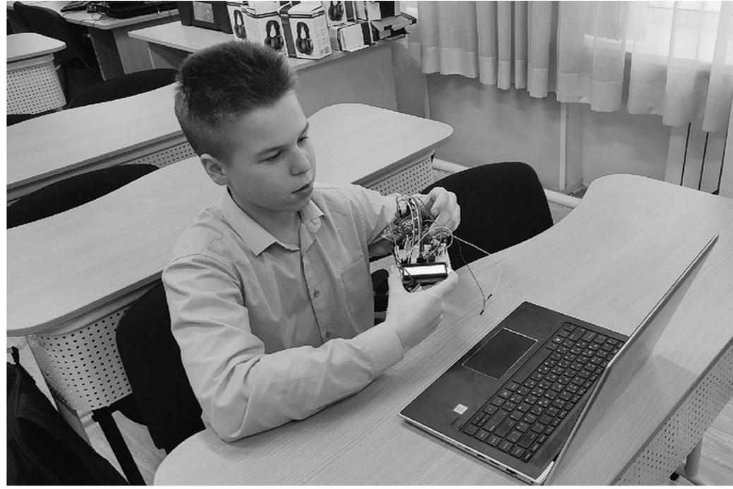
Нацпроект "Образование" в действии. Сорокинские школьники защищают проекты по робототехнике на областном уровне

В ноябре 2021 года детские сады активно включились в работу на образовательном пор-