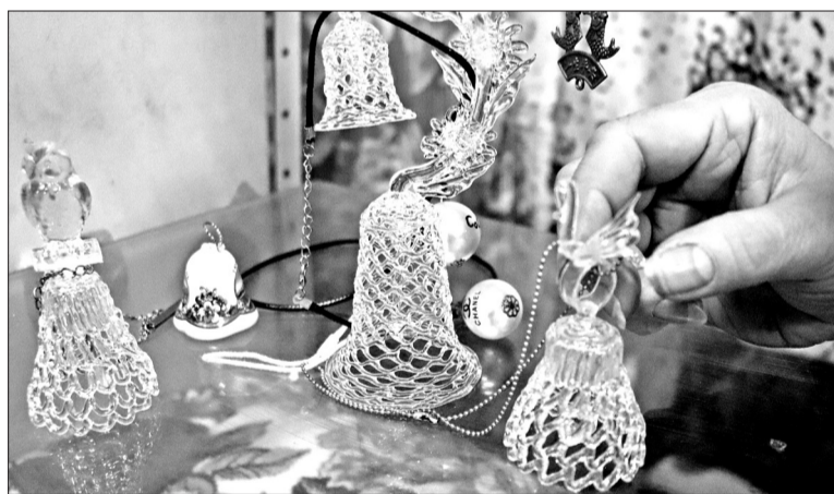
📷 Колокольчики, изготовленные в городе Гусь-Хрустальном, славятся своим мелодичным и красивым звоном.

Мир увлечений. Кампанофилия – так называется хобби нашей землячки