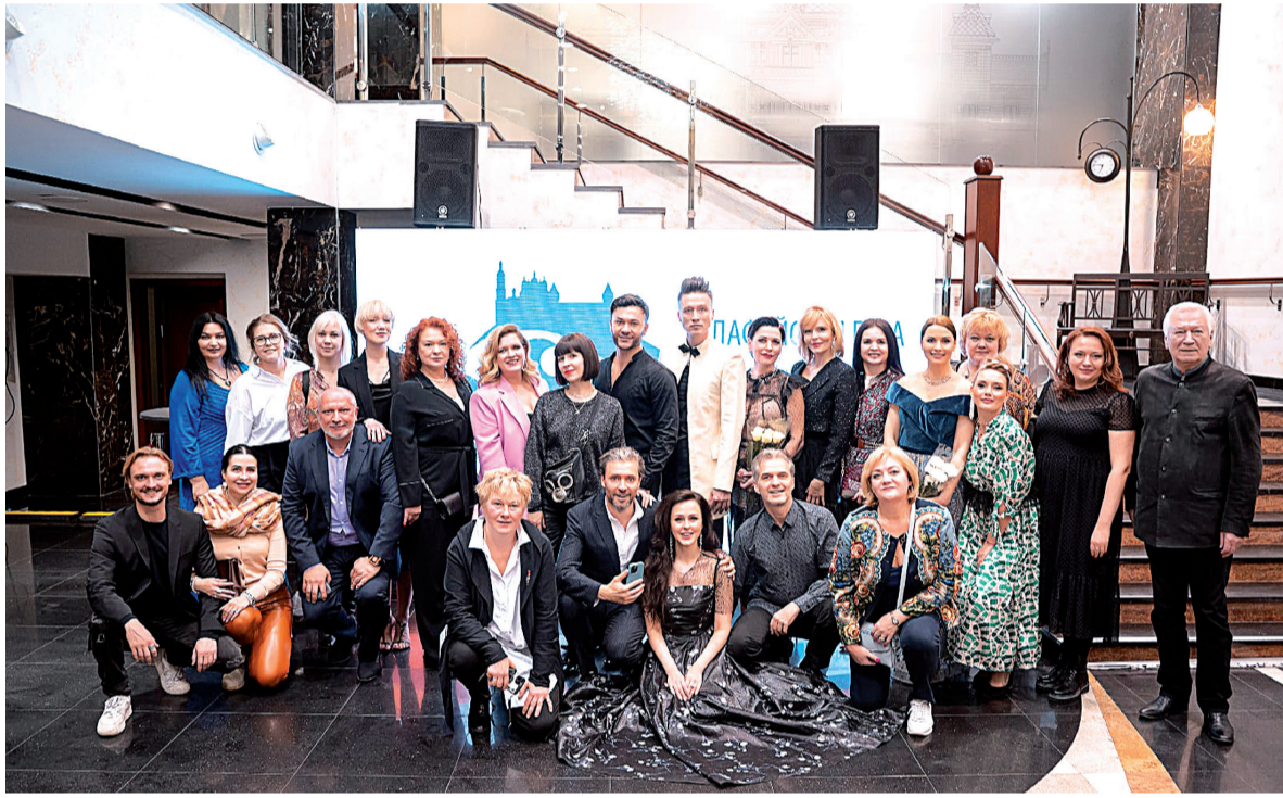
Многие звёзды признались, что влюбились в Тобольск и хотят вернуться сюда летом

Но видели ли вы, скажем, на Лазурном берегу, как над красной дорожкой кружат снежные хлопья? В Тобольске даже в конце марта это вполне ожидаемо, и на церемонию открытия в ДК