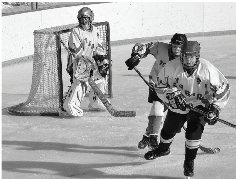
Одно из направлений работы ДЮСШ – хоккейная секция. На фото – момент юбилейного матча.