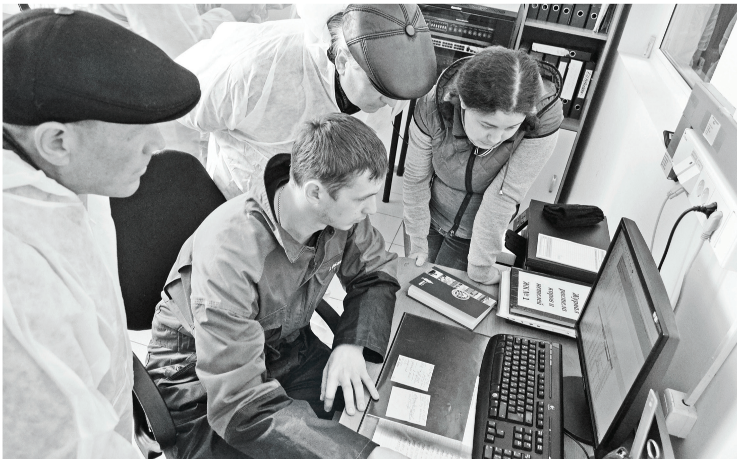
Под контролем в режиме реального времени состояние животных и их продуктивность.

Долгое время наше сельскохозяйственное производство шло по экстенсивному пути развития. Не помогли ни призывы о росте производительности труда, ни лозунги насчёт экономной экономики. Рост валового производства сельхозпродукции больше ориентировался на расширение посевных площадей в растениеводстве и увеличение поголовья скота, в том числе и дойного стада, в животноводстве.