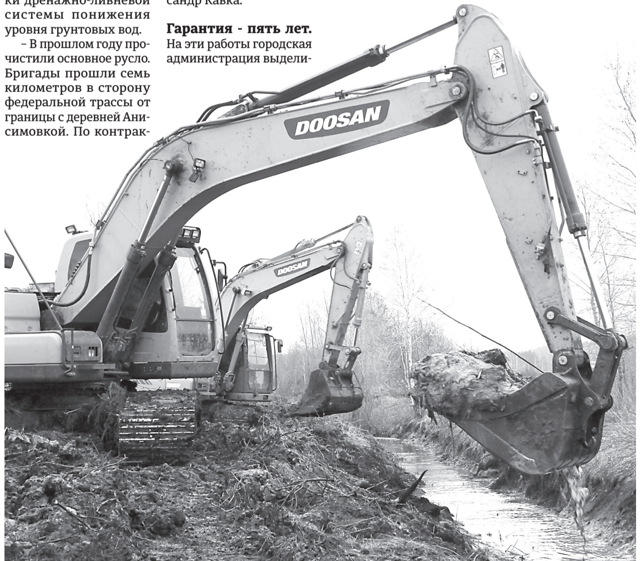
Тяжёлая техника формирует берега канала в районе ул. Враницкого

Вся водопонижающая сеть города насчитывает 36 километров, так что благоустроителям есть чем заняться в будущем. А вот владельцы дач в конце улицы Агеева и жители новостройки должны ощутить уменьшение влажности почв на своих участках уже летом. Если же этого не случится, то на выполненные работы есть гарантия - пять лет.