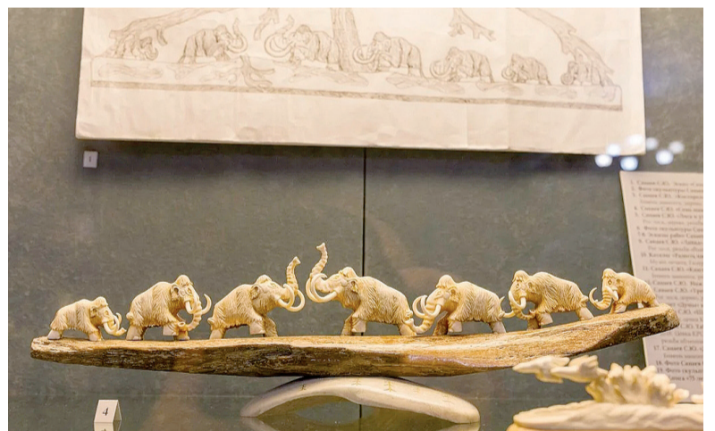
► Семь мамонтов