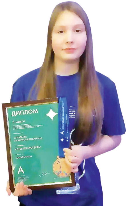
► Анастасия Игнатъева.