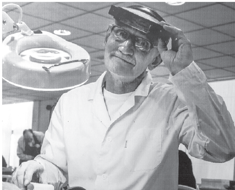
► Сергей Санаев.

Работы Сергея Санаева напоминают о классическом виде тобольской резной кости – без экспериментальных искажений