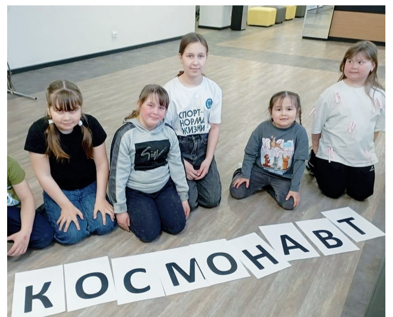
▶ В Булашово открыли двери в космос.

В дни космической недели распахнулись для детворы двери Булашовского дома культуры . Культработники пригласили детей на увлекательную игровую программу «В космос всем открыта дверь». Участники экипажей «Звезда» и «Юпитер» с азартом прошли через все испытания: отвечали на вопросы, разгадывали загадки о планетах и звёздах, продемонстрировали ловкость и вы-