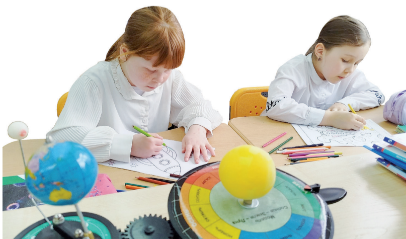
▶ Каждому жителю Малозоркальцево – по ракете!