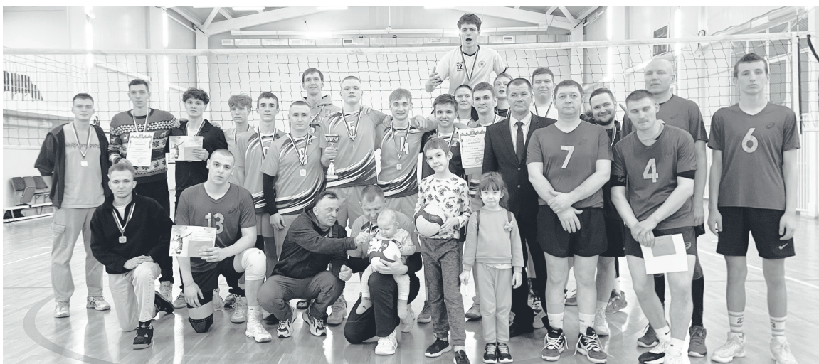
Соревнования по волейболу сплотили спортсменов из разных регионов.