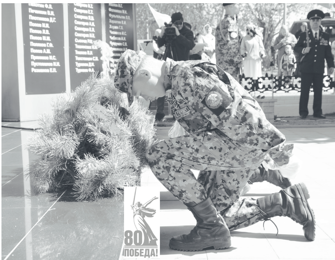
Преклоняя колени при возложении цветов, молодёжь отдаёт дань памяти погибшим солдатам.

После схода снега, в апреле и мае, на территориях сельских