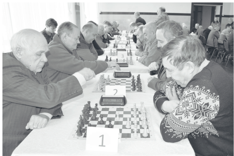
Шахматный турнир собрал более сорока игроков.