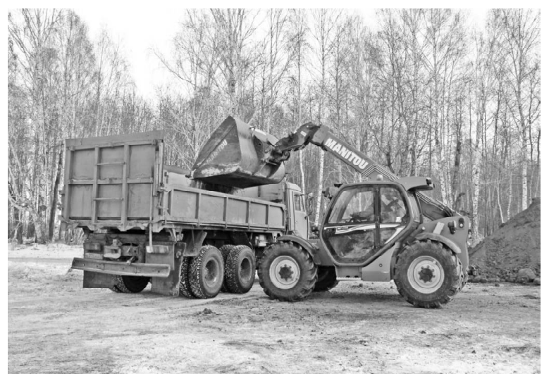
➤ Внесение в почву органических удобрений