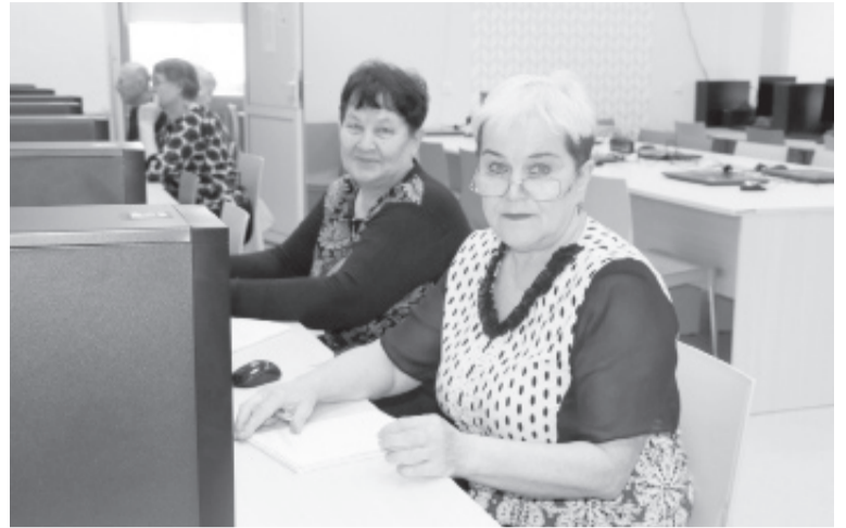
|| Жительницы Приисетья освоили компьютер.

Многим творческим людям хочется знать больше о возможностях текстового редактора. Ведь появилась возможность записать свои мысли не только на листе бумаги, но и в электронном виде. Этот файл может быть распечатан, отправлен в любой уголок мира. А как это сделать, разбирали на уроке, посвящённом Интернету. Интернетовало пенсионеров и что