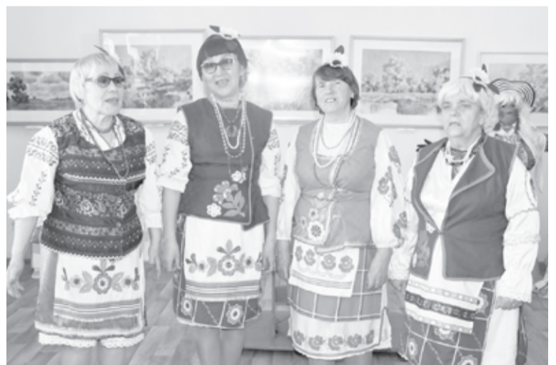
|| Украинские песни исполнили жительницы с.Верхнебешкиль.

Этим словам столько лет, и они так нужны сейчас, в настоящем времени. За освобождение Украины бок о бок сра-