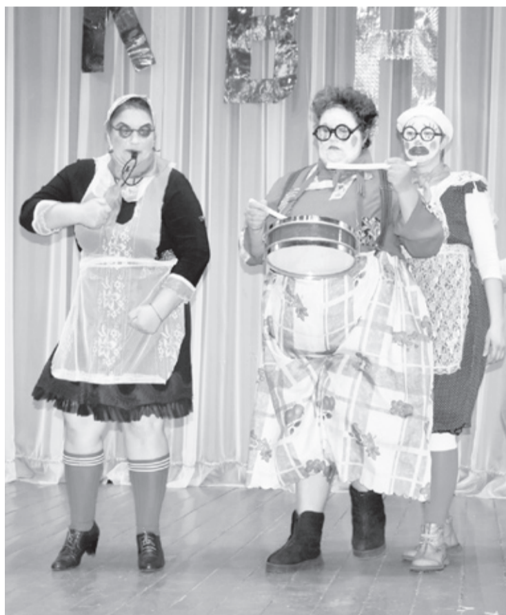
Команда «Клавы» играла в пионеров.

В конкурсе капитанов лидеры команд восхваляли свои