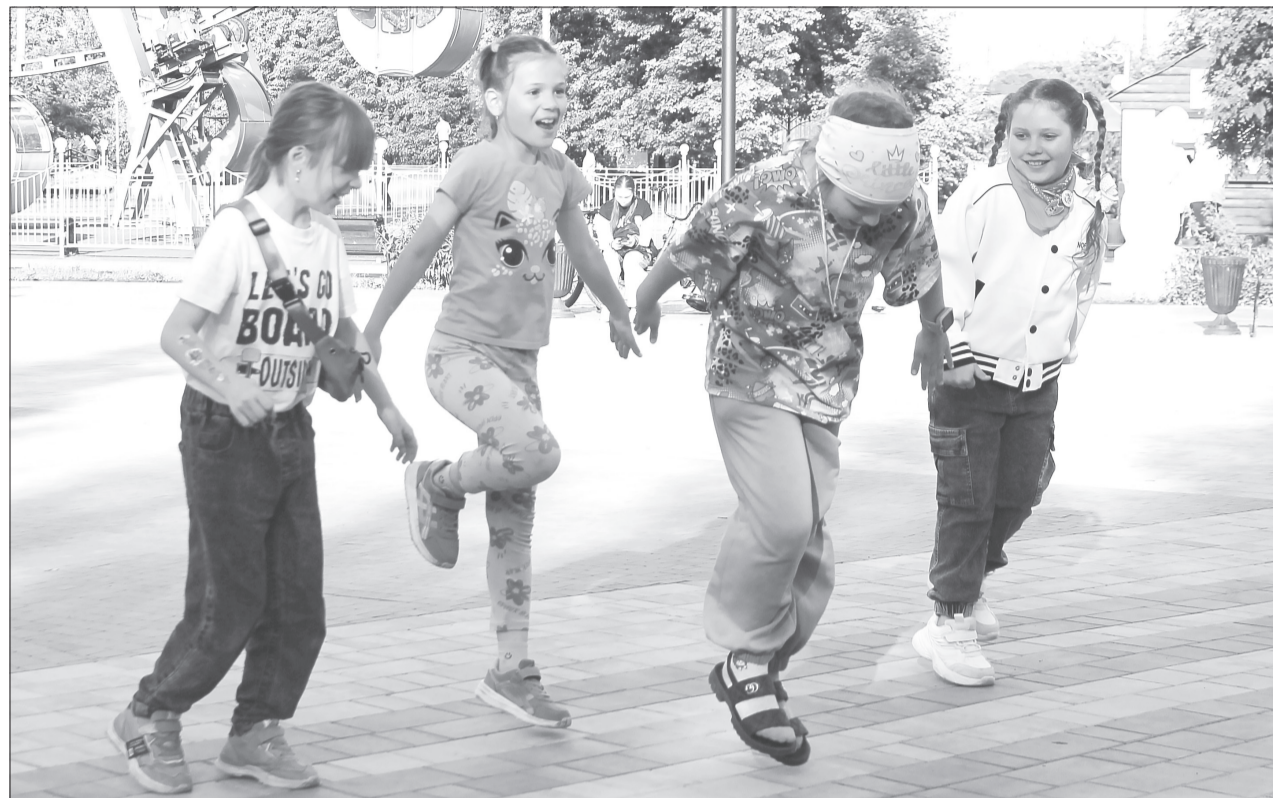
Танцевальный батл юных участников программы оказался очень весёлым

Маленьких ялуторовчан приглашают в горсад