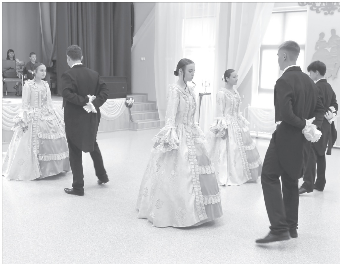
С каждым годом количество участников бала растёт. В этот раз только детей выступило более пятидесяти человек

Автором всех хореографических постановок бала «Возрождая традиции» является