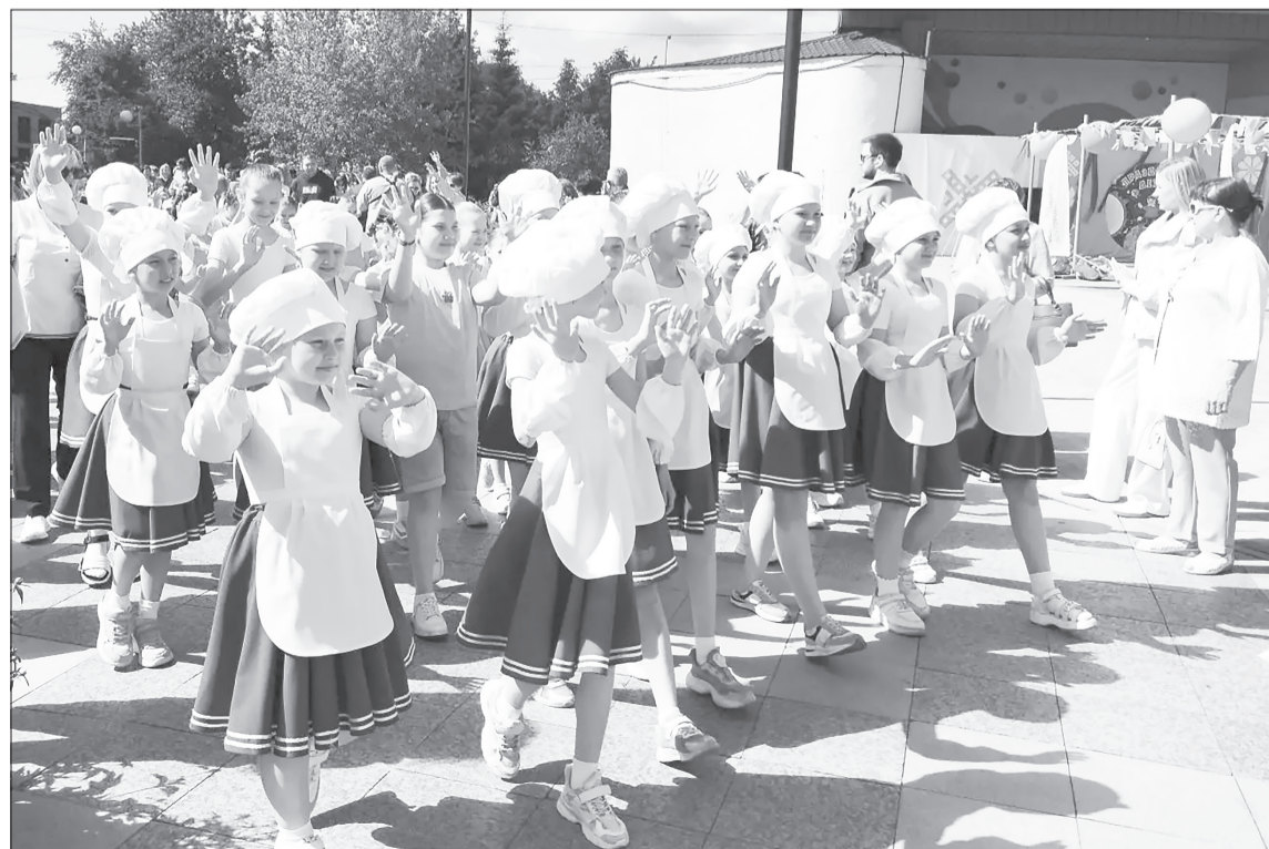
Праздник открылся дружным шествием