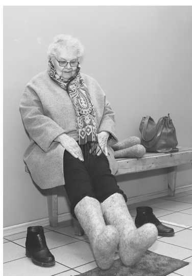
Покупательница выбрала валенки по размеру – хороши