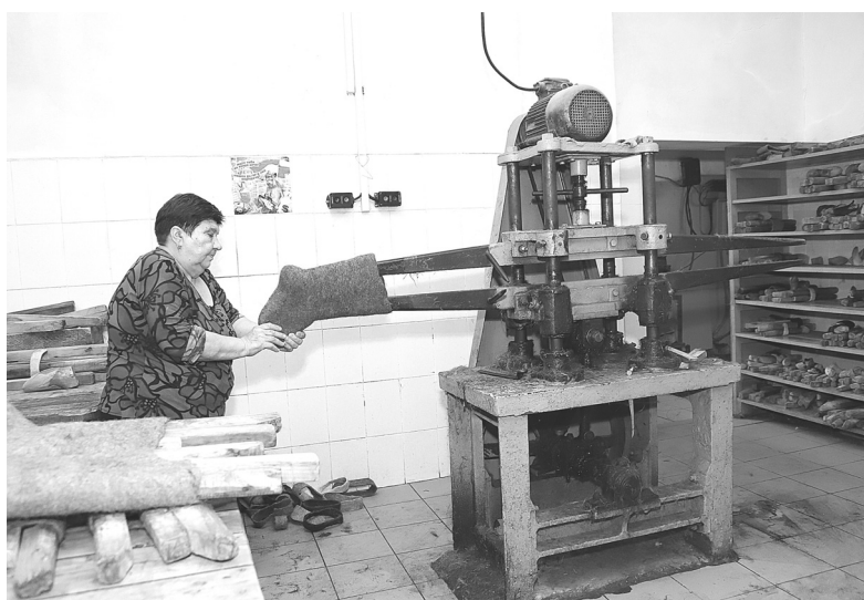
В цехе валяной обуви по сей день используется старинный аппарат, который специалисты называют «крокодилом»