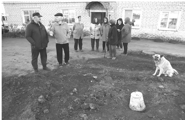
Жильцы дома в посёлке Голышманово по улице Карла Маркса, 90, вышли дружно во двор – показали работу коммунальщиков