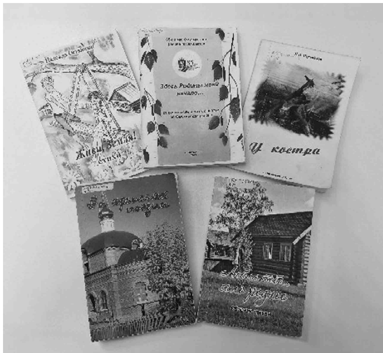
Сборники местных поэтов представлены в Центральной библиотеке на книжной выставке, посвященной 95-летию Омутинского округа

К 85-летию Омутинского района в 2016 году Центральная библиотека отпечатала сборник стихов, изданный по инициативе районного совета ветеранов, с красивым названием -