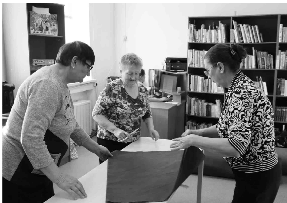
Работа в группе идет организованно, у каждого своя задача

вых условиях всегда найдется, где применить веревку, говорит Наталья Александровна. Но, если обычная может запутаться, то эта удобно сложена в виде браслета. Специальная схема плетения позволяет в любой момент быстро извлечь из браслета надежный трос длиной до 5 метров. Он понадобится для закрепления грузов, перетягивания патронов под шквальным огнем, при транспортировке раненых, им можно зафиксировать шину на поврежденной конечности или использовать в качестве жгута, для просушки одежды.