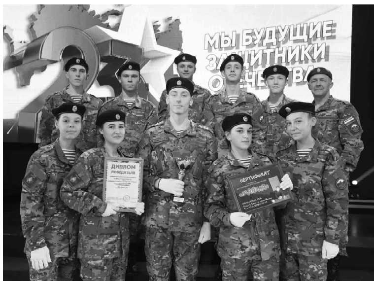
«Медведи» получили кубок и награды районного конкурса

Ребята показывали навыки в представлении команды, выносе знамени, соревновались в ловкости и точности в военизированной эстафете. Курсанты творчески подошли к главному конкурсу «Смотр песни и строя». В традиционный марш с песней участники внесли художественные элементы: живое звучание баяна, танец, акробатику. Все