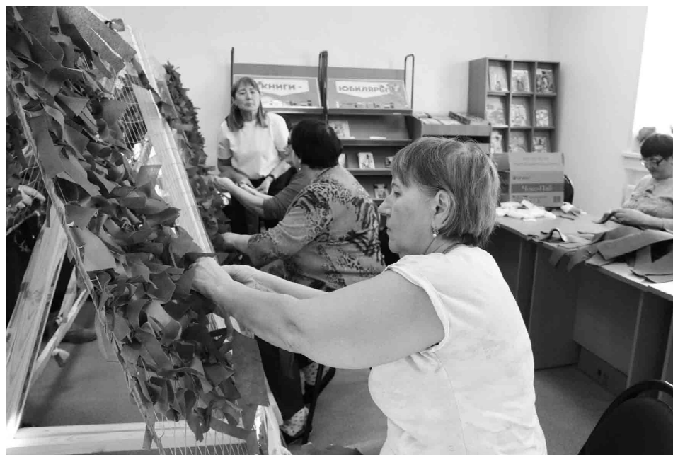
Добровольцы вносят свою лепту в плетение маскировочных сетей

Группа омутинских активистов организует сбор помощи бойцам спецоперации