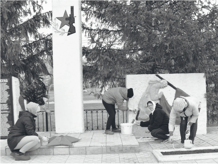
В преддверии Дня Победы скородумцы навели порядок возле памятника.