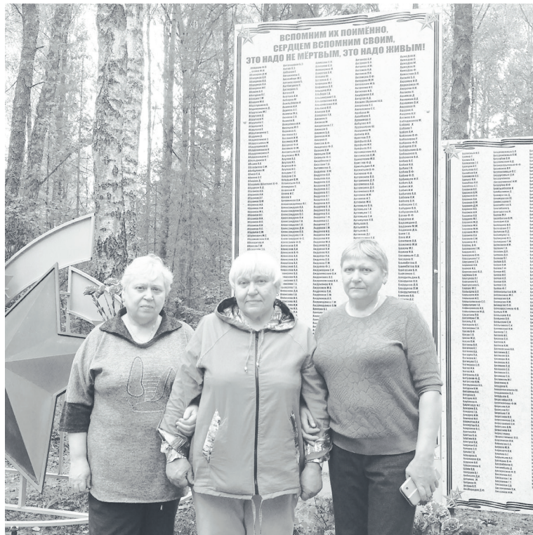
Сёстры выполнили просьбу отца, посетив место гибели его брата.