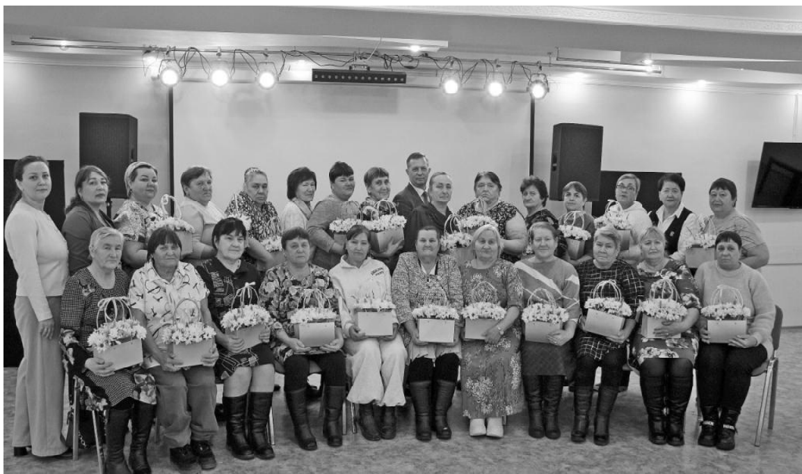
Участники социальной гостиной в День матери

На минувшей неделе в районном Доме культуры в рамках социальной гостиной состоялась встреча матерей участников вооружённых конфликтов, специальной военной операции с представителями администрации.