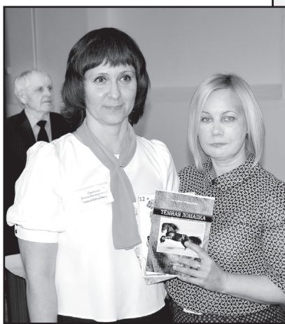
Книги в подарок

В стихах омутинских авторов из клуба «Родники» – трогательная преданность своей малой родине, слитность с ней на года, на века. Среди авторов немало тех, на чью долю выпали безмерные тяготы и испытания военных лет. В их творчестве – личные впечатления, которые впечатались в юношеские сердца и память. Свидетелей тех легендарных лет и событий литературный салон принимал с особым теплом и благодарением.