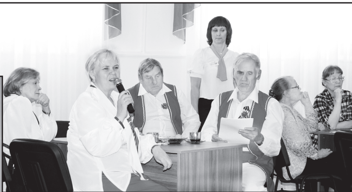
В творчестве авторов – личные впечатления о войне

Тема малой родины, Победы, мира и добра будет звучать