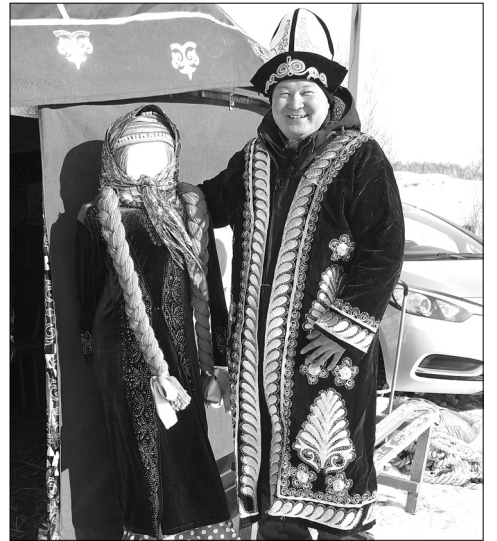
Культуру и традиции казахов отражали и юрта, и национальные костюмы участников