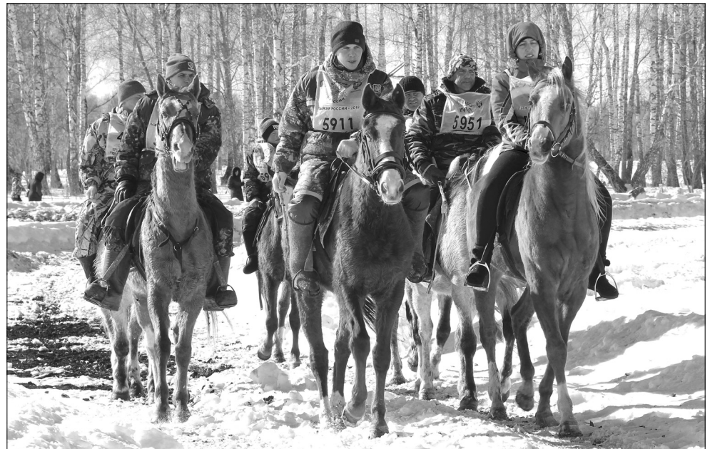
Поучаствовать в конных скачках в Земляную прибыли не только жители нашего округа, но и других районов Тюменской области