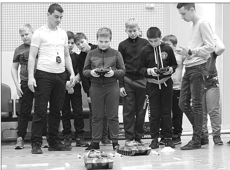
Каждый участник «Стальной гвардии» смог почувствовать себя пилотом радиоуправляемой техники

Около 50 школьников собрались в Голышмановском молодёжном центре. Им предстояло продемонстрировать участие в профориентационном конкурсе-игре «Стальная гвар-