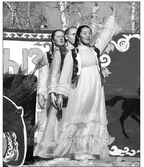
Самодеятельные артисты развлекали народ танцами и песнями