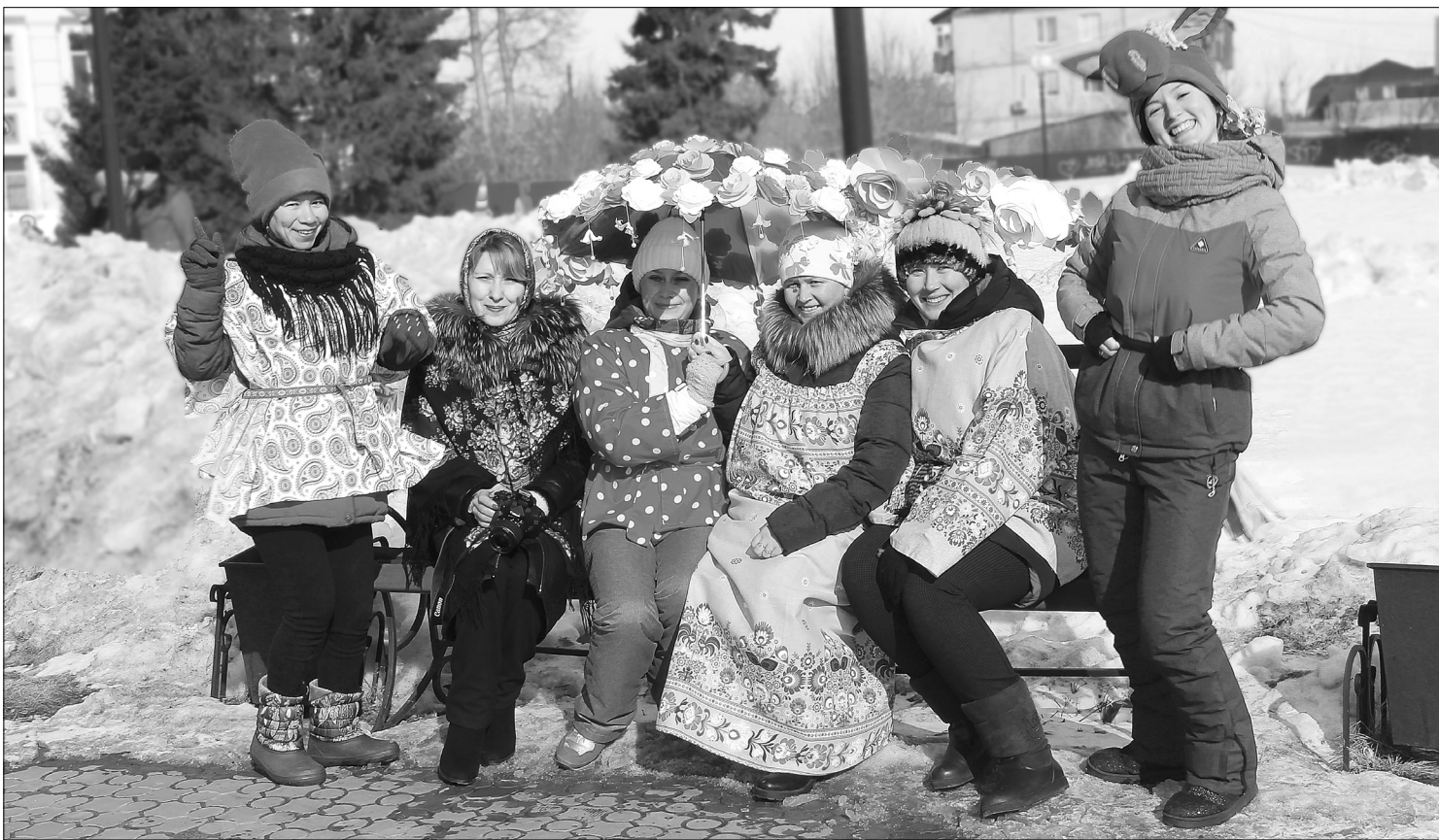
На фоне большого сугроба под ярким цветочным зонтиком – мастерицы детского сада «Ягодка»