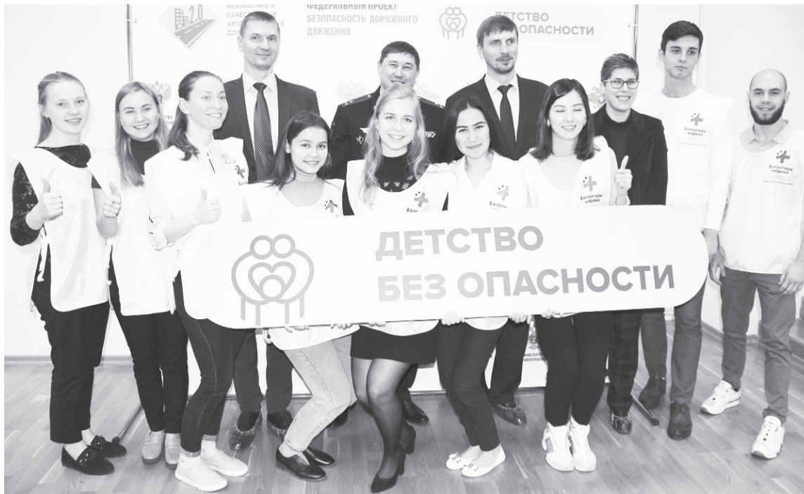
Участники первого тренингового занятия и пресс-конференции.

За последние десять лет количество погибших детей-пассажиров снизилось на 16 процентов. Но