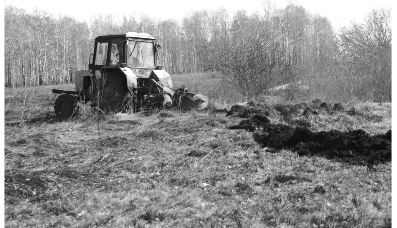
Устройство минерализованных полос между лесом и сельхозугодьями – обязанность агропредприятий