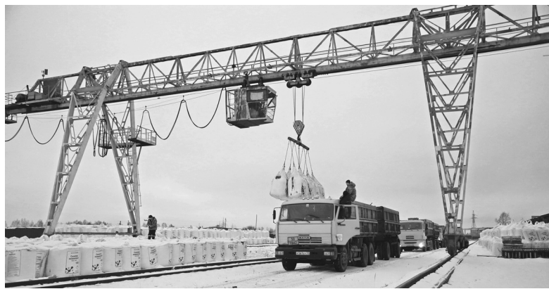
Удобрения для сельхозпредприятий нашего округа и ближайших районов завозятся через ОАО «Голышмановоагропромснаб»

На 2024 год утверждены ставки несвязанной финансовой поддержки. На один гектар, занятый зерновыми и зернобобовыми культурами, выдадут 395 рублей. Для кормовых культур без многолетних трав прошлых лет, включая зерновые кормовые культуры, ставка – 300 рублей на гектар. На масличные, за исключением рапса и сои – 490 рублей на гектар.