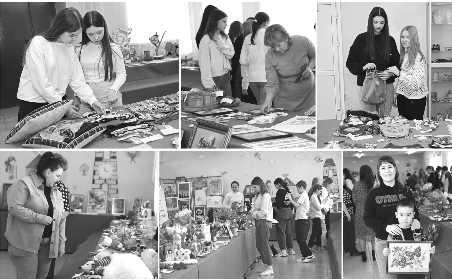
Посетители экспозиции в молодёжном центре могли воочию лицезреть эту красоту, не упустив каждую деталь задумки авторов. А мастера рукоделия – сравнить со своими работами и взять на заметку что-то для себя

Более 400 работ представили в этом году участники окружного конкурса-выставки художественного и декоративно-прикладного творчества