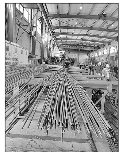
«Орион». Тысяча тонн изделий ежемесячно.

Мария КОРАБЛЕВА.