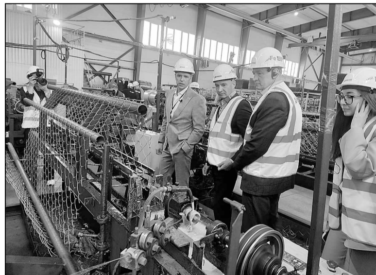
Здесь производят сетку-рабицу.

«Орион» производит продукцию, без которой не обходится ни одна стройка: изделия из проволоки и арматуры, обеспечивающие прочность и долговечность бетону, железобетону, монолитным конструкциям. Весь перечень продукции трудно перечислить. Ежемесячно здесь выпускают до тысячи тонн изделий: кладочная сетка, арматурные каркасы, сетка-рабица, вязальная проволока, цельнометаллическая