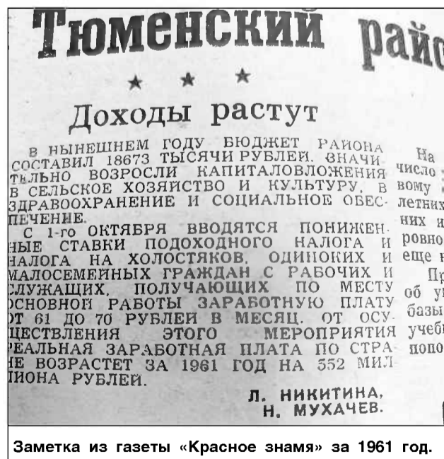
Заметка из газеты «Красное знамя» за 1961 год.

Сохранился налог и в послевоенные годы. Он одновременно был инструментом пополнения