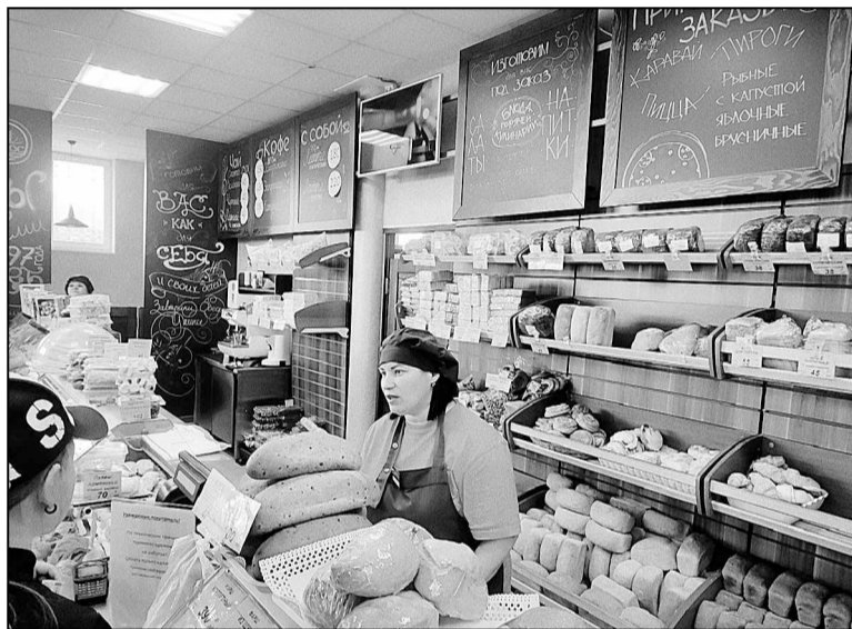
В магазине предприятия «Колос».