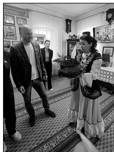
Универсальный самовар-кухня из музея.

сто успешные предприниматели. Это увлеченные своим делом люди, которые вкладывают душу в производство, их отличает активная жизненная позиция, они при всей своей занятости находят время для общественной работы, занимаются благотворительностью.