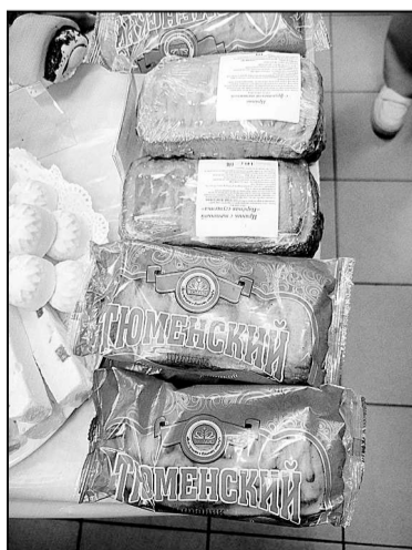
Фирменный пряник «Колоса» – «Тюменский».