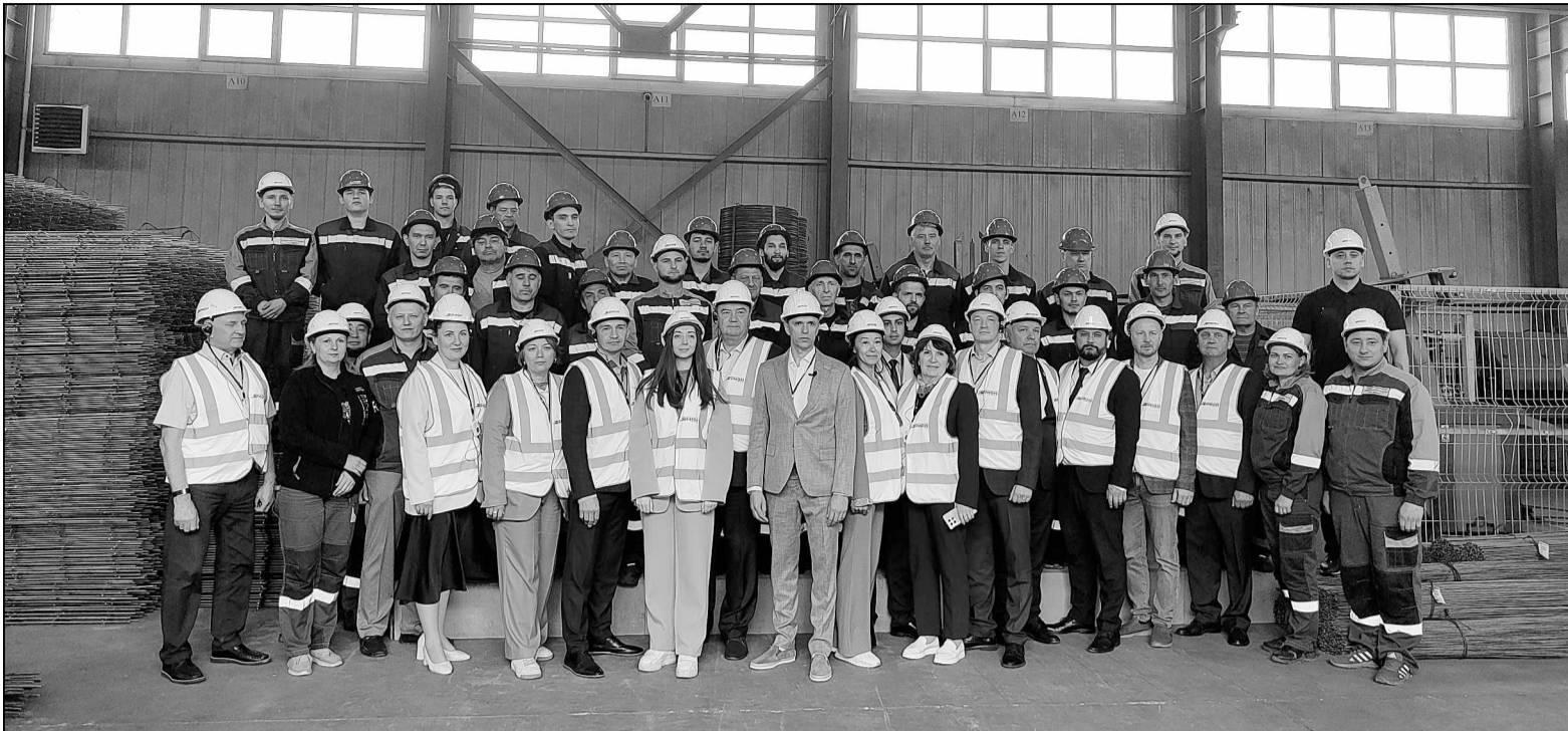
Сотрудники завода «Орион» и депутаты окружной Думы. Фото на память.