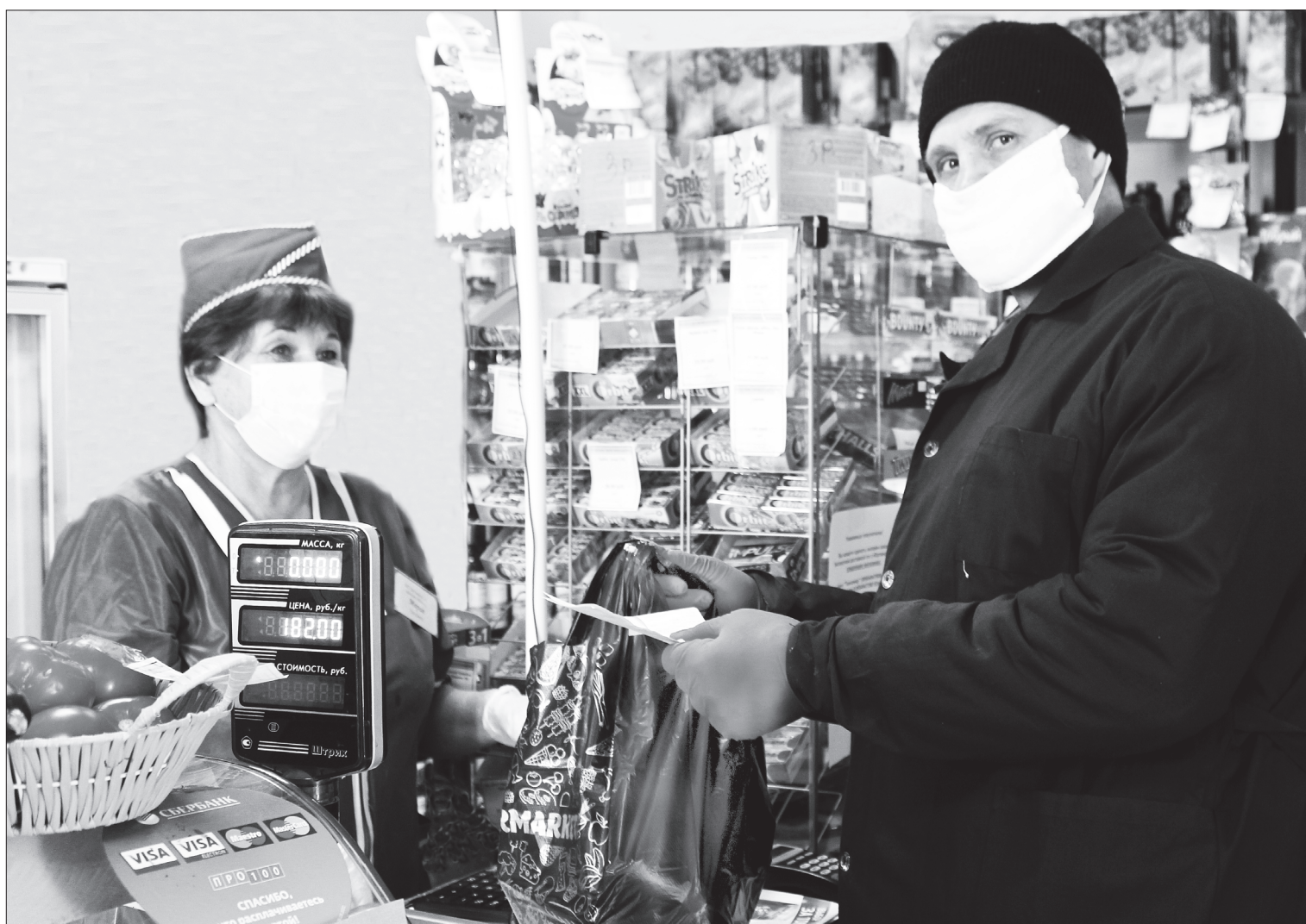
В дни самоизоляции доставить товары первой необходимости на дом готовы коллективы частных торговых предприятий

Тем клиентам, которых в момент доставки не было дома, пенсия будет доставлена повторно до 23 апреля.