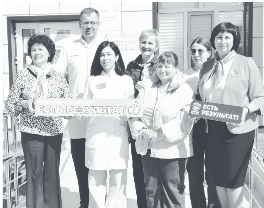
Комиссия оценила эффективность реализации Народной программы в медучреждении муниципалитета.