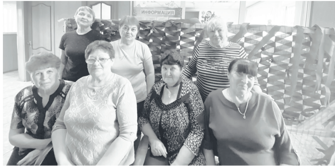
Волонтеры первички изготавливают маскировочные сети для отправки их в зону СВО.

Людмила ИВЛЕВА Фото из архива первичной ветеранской организации