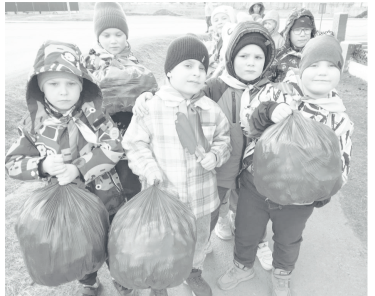
Малыши группы «Лучики» поучаствовали в субботнике.