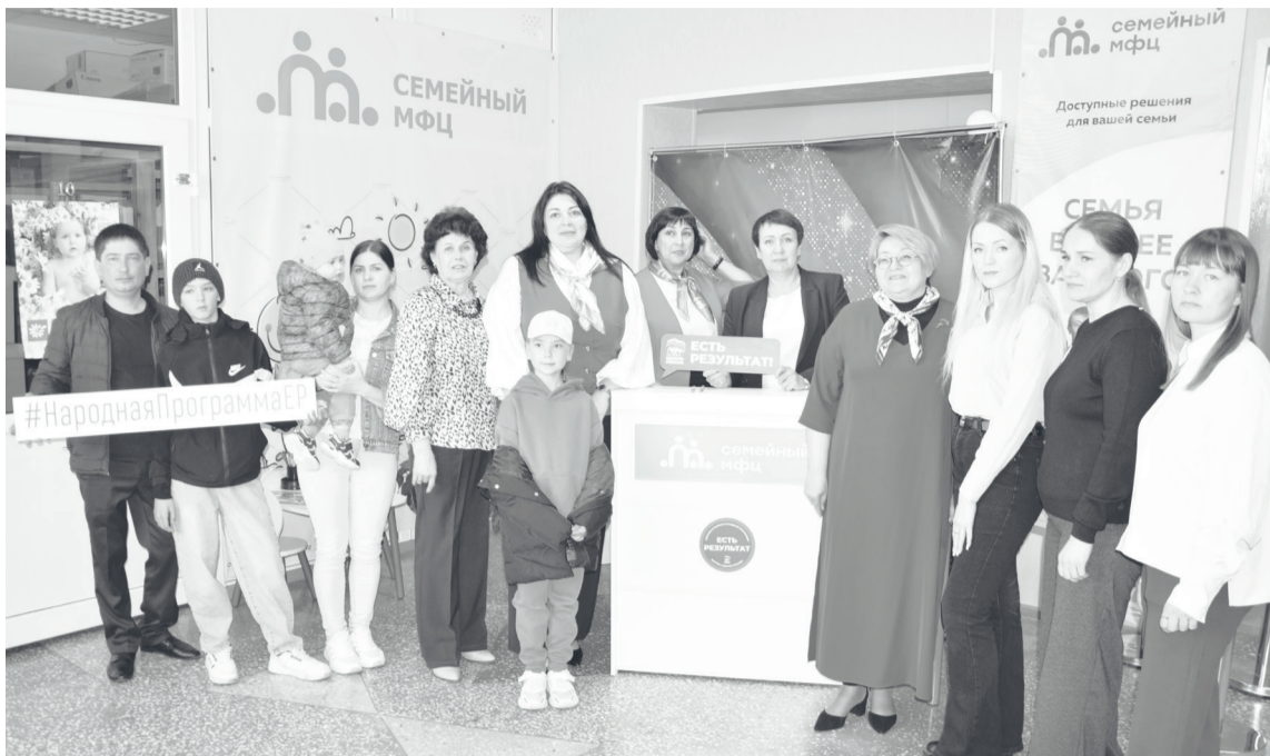
«Есть результат» – такое заключение сделали общественники после экскурсии по семейному МФЦ.

В подтверждение сказанного он показал членам Народной комиссии аппарат компьютерной томографии, установленный в поликлинике, на котором можно пройти исследования головного мозга, позвоночника, органов грудной клетки, брюшной полости, малого таза.