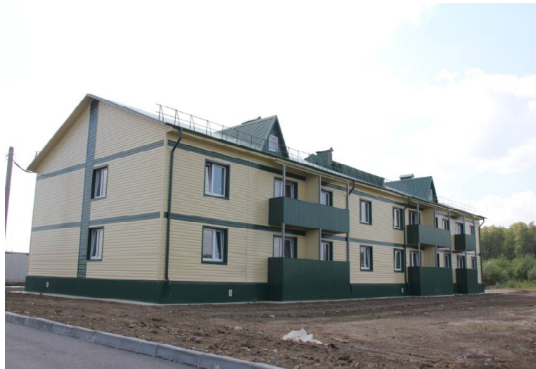
➤ Новый дом в с. Викулово