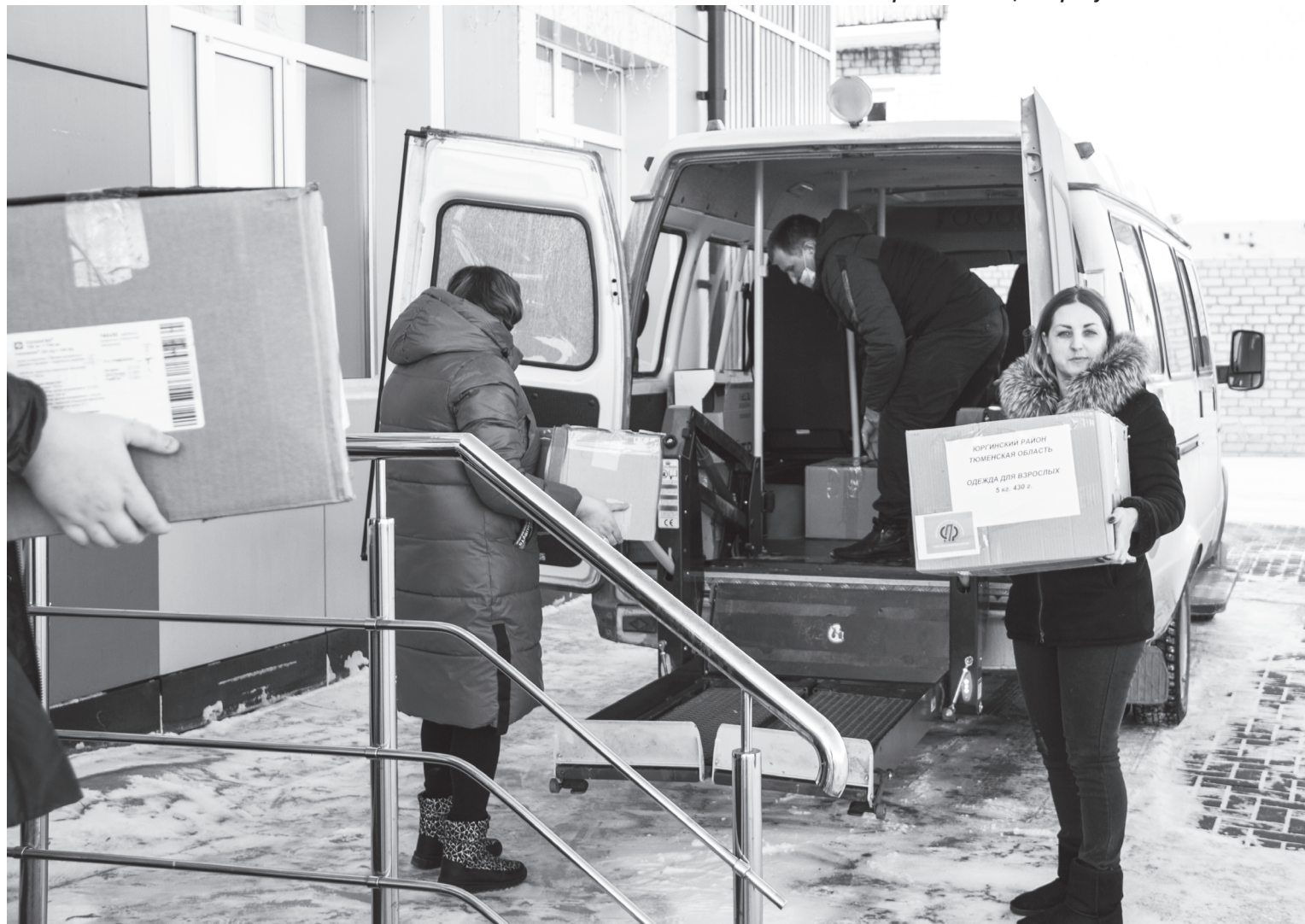
Готовится к отправке в областную столицу очередная партия посылок от юргинцев