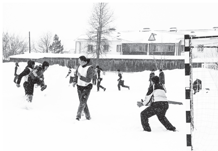
МИНИ-ФУТБОЛ НА СНЕГУ (МУЖЧИНЫ) I место – Володинское сельское поселение, II место – отделение полиции, III место – пожарно-спасательная часть.