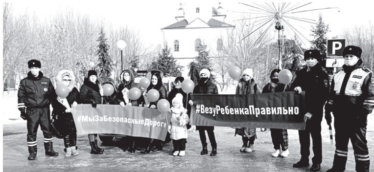
Юргинцы – за безопасные дороги

Важно быть сознательными водителями, не нарушать правила и использовать только надёжные средства защиты при перевозке юных пассажиров, считают юргинские мамы.