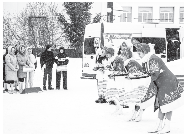
Блинами встречали дорогих гостей на районных зимних сельских спортивных играх

Праздничные выходные марта в Юргинском районе были по-настоящему «жаркими». Сильнее, быстрее, точнее – именно эти три слова я бы определила настроение участников XXXIII районных зимних сельских спортивных игр.