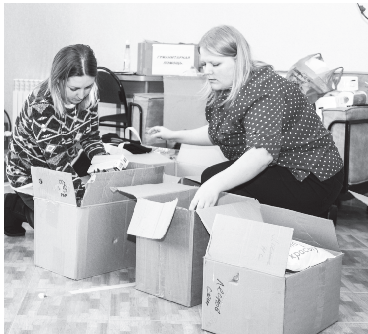
Желающие внести свой вклад в гуманитарную помощь приносят вещи и продукты