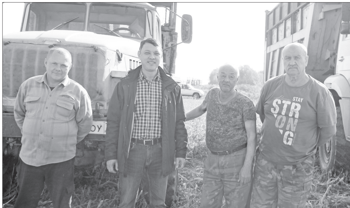
📍 Дружная команда агрохолдинга «Нижнетавдинский» приступила к уборке кукурузы.