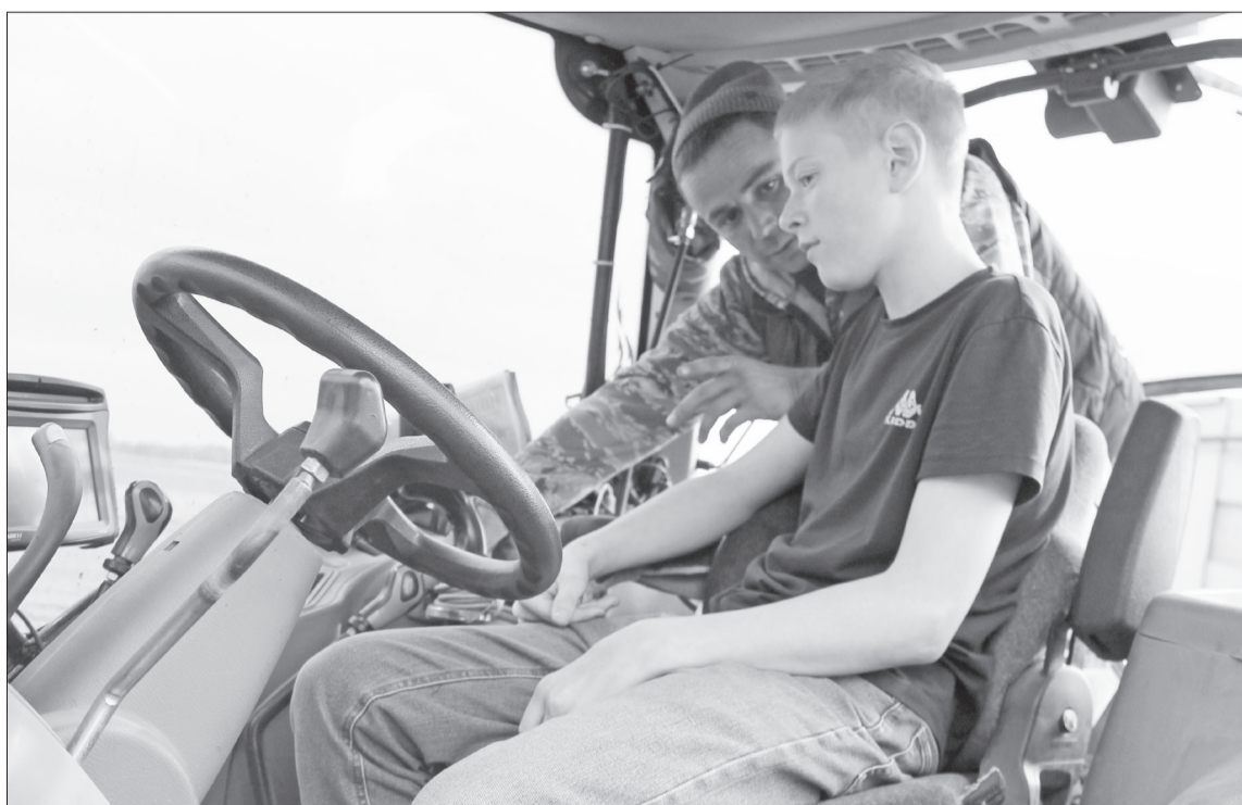
Опытные механизаторы провели мастер-класс по работе на тракторах и комбайнах.

– Прежде всего, у нас хорошая зарплата. Во время уборочных работ, можно заработать 120 000 рублей в месяц. В другие периоды года зарплата колеблется от 30 000 до 50 000. В это время механизаторы занимаются ремонтом техники. Агрохолдинг обеспечивает полный социальный пакет, включающий оплачиваемый больничный и отпуск. Для иногородних специалистов, которые необходимы предприятию, приобретается жи-