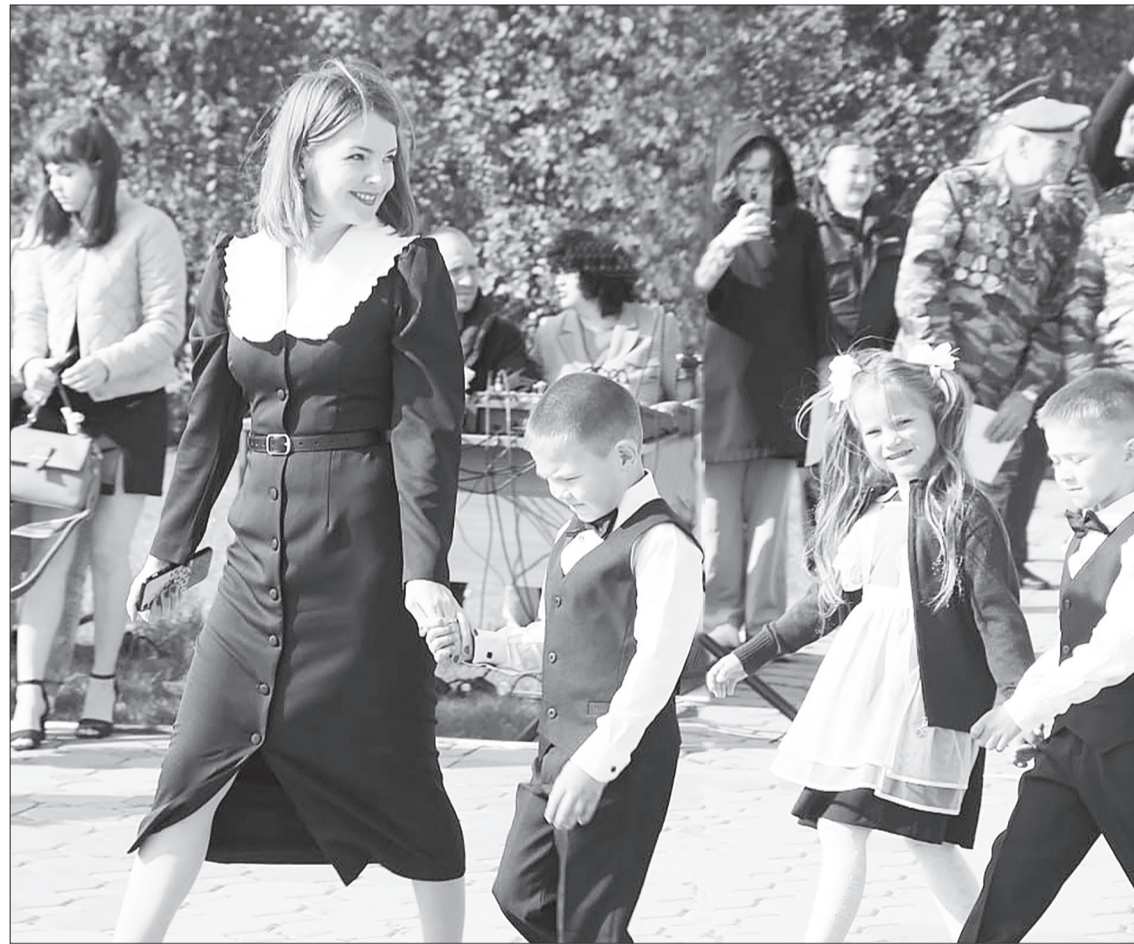
Учиться идём весело и с желанием.

Школьные психологи выделяют несколько критериев готовности ребёнка к учёбе: личностный, интеллектуальный, физиологический, социально-психологический. Личностный критерий развит, если ребёнок хочет в школу, стремится получить знания. Интеллектуальный – включает грамотную устную речь, умение слушать учителя, физиологический – отсутствие отклонений в развитии, психологическую устойчивость. Социально-психологический – умение общаться со свер-