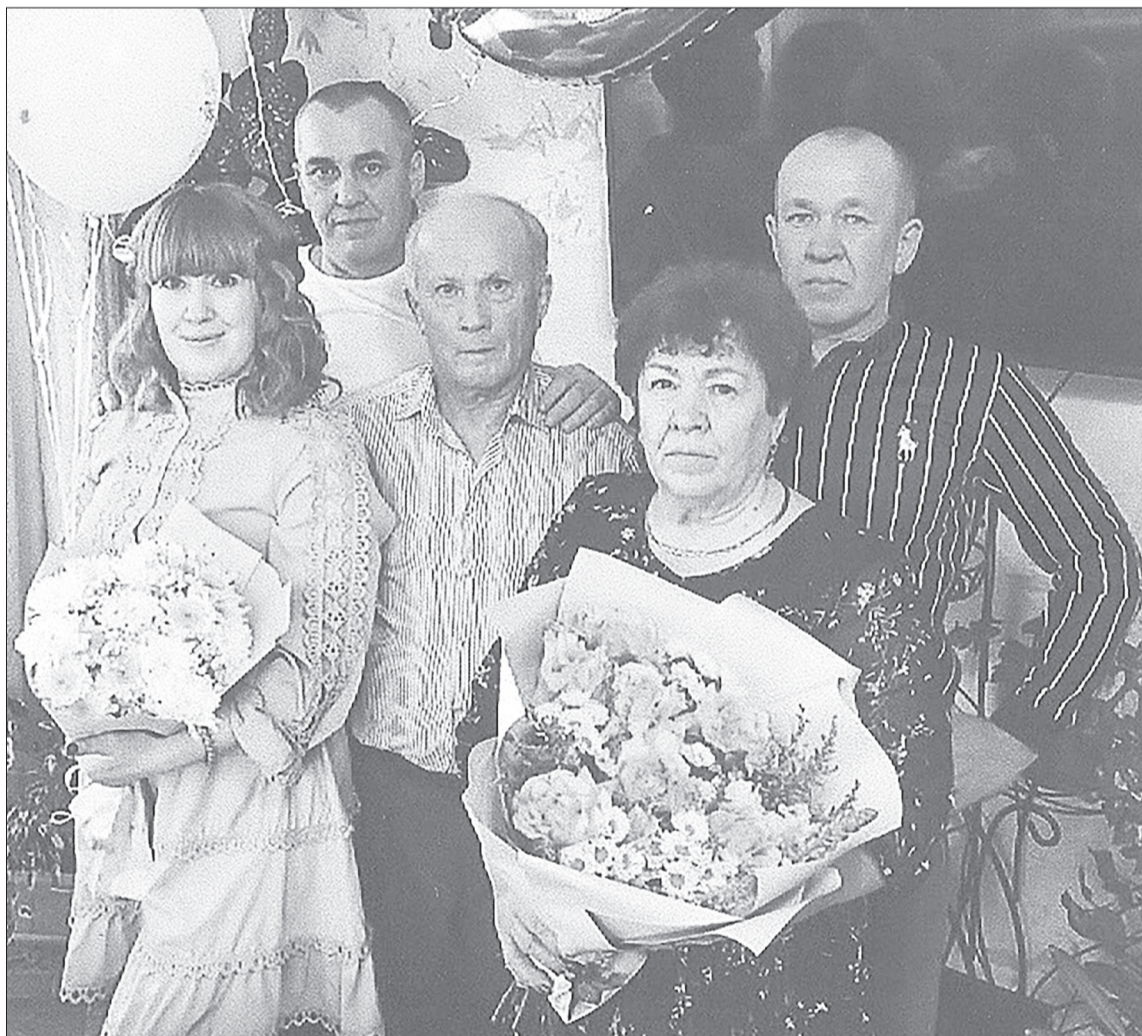
Папа, мама, дети, которые всегда рядом с родителями.

колхозе, был механиком, водителем, главой поселения, он всегда находил время и для детей, и для своей любимой.