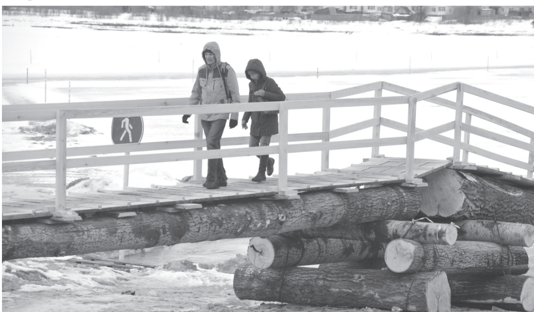
Игра в русскую рулетку

Пока верстался номер, лёд в районе переправы оторвало. Госинспекторы ГИМС сняли с мостков семь человек.