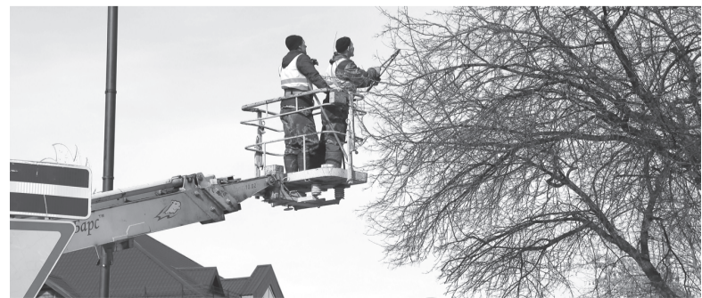
У деревьев свои парикмахеры

Автовышка, секатор, опытные, умелые руки – и дело спорится. За этим важным для интерьера улиц занятием мы и застали бригаду озеленителей на Октябрьской. Впереди у них стрижка деревьев на всех главных улицах и проспектах города. И делать это лучше до