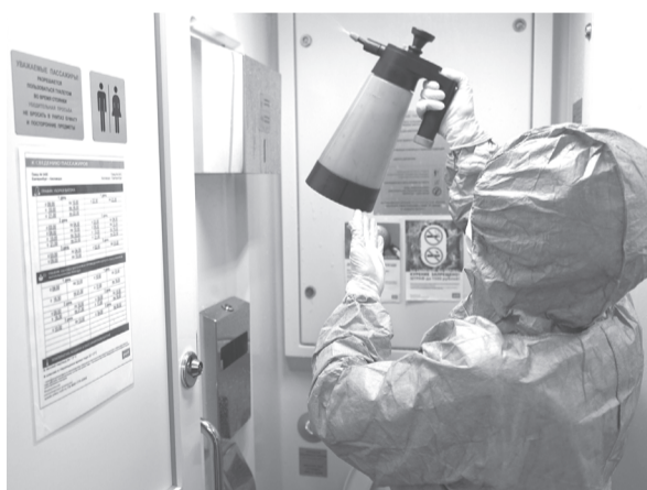
Работник специализированной организации обрабатывает помещения пассажирского вагона дезинфицирующими средствами

В поездах, на вокзалах и станциях обеспечен запас специальных моющих средств, которыми проводится регулярная дезинфекция всех помещений, отлажена работа установок обеззараживания воздуха. Железнодорожники укомплектованы бактерицидными лампами, организована ревизия вентиляционных систем. На вокзалах организовано аудиооповещение пассажиров о мерах профилактики коронавирусной инфекции.