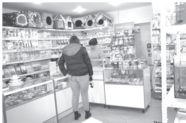
За кормом для питомцев

В зоомагазине «Айболит», что находится в 7 «а» микрорайоне, слышна весёлая песенка в исполнении попугайчиков, в аквариумах носятся стайками рыбки. Легко идут на контакт с покупателями два белых пушистых хомячка. В общем, все пернатые, хвостатые, плавниковые обитатели зоомагазина, похоже, появ-