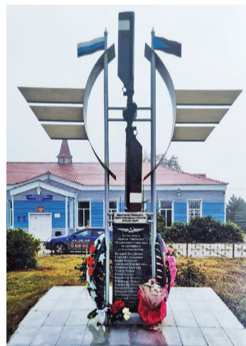
► Обелиск погибшим авиаторам в аэропорту Тобольска (Медянки Татарские)

В мае 1932 года на слиянии Иртыша и Тобола выполнил посадку гидросамолёт Ш-2 (его ласково называли Шаврушкой). «Ясным солнечным днём на мысу собралась многочисленная публика, не только весь персонал только что открытого гидропорта, но и горожане, и жители деревни Татарские