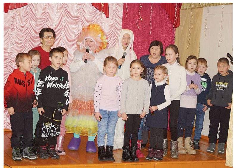
▶ Участники фестиваля «Дни татарской культуры»