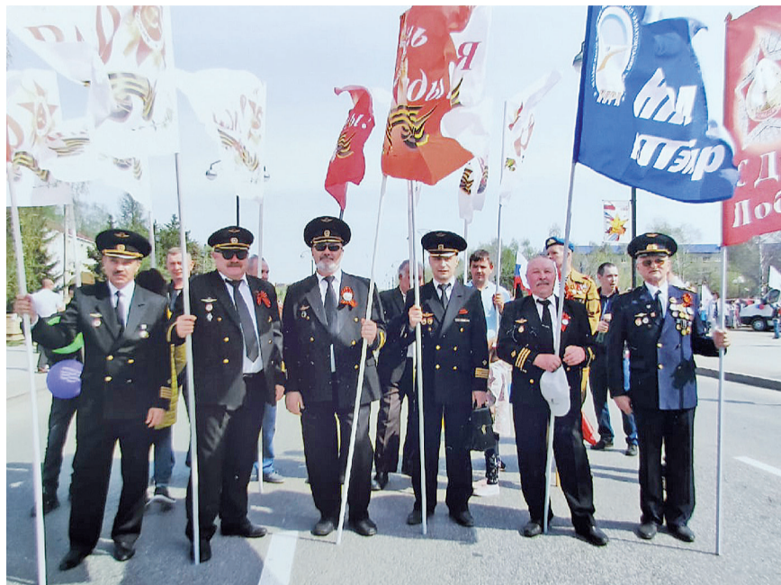
► Вертолётная эскадрилья Тобольска на параде Победы

Медянки. Все ждали первого «клиента», – так описывала события «Тобольская правда».