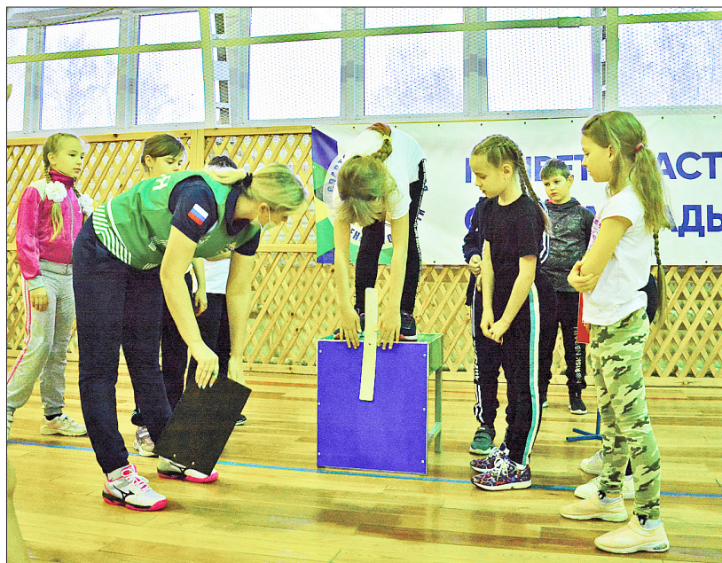
Школьники демонстрируют гибкость и пластичность

Теперь у ребят появилась возможность выполнять нормативы на знак ГТО на уроках физической культуры. Отметим, что такие занятия проходят в рамках всероссийской акции «Неделя ГТО» под эгидой федерального проекта «Спорт – норма жизни» национального проекта «Демография».