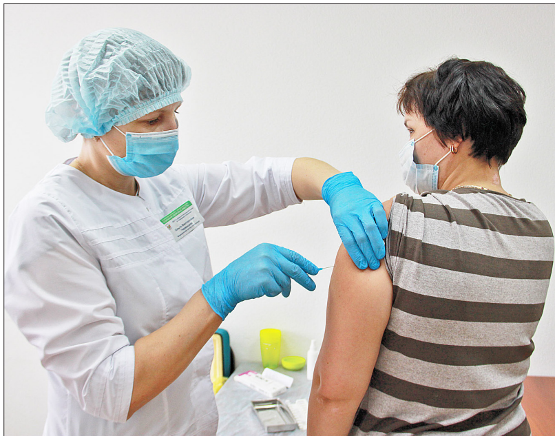
Практика давно уже доказала, что прививки помогают сохранить здоровье

Второе: необходимо — то, что я слышу от специалистов, — иметь некоторый «разбег» между различными прививками. Скажем, от гриппа и от коронавируса. Некоторые специалисты говорят о том, что это должна быть разница в две недели, другие говорят, что это должна быть разница как минимум в че-