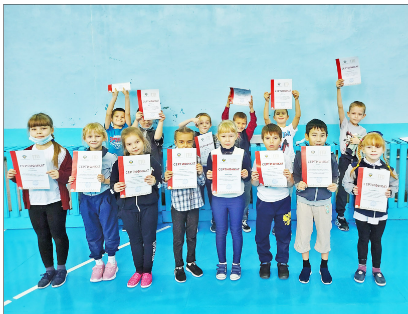
Юные большеярковские спортсмены

10 декабря первоклассники Большеярковской школы, занимающиеся по программе «Геркулес», приступили к выполнению нормативов ГТО. Напомним, что в Казанской районной ДЮСШ с нового учебного года реализуется три образовательных программы: краткосрочные дополнительные общеобразовательные модульные програм-