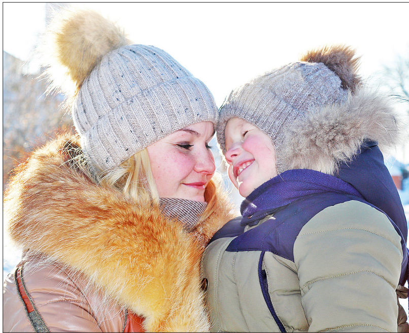
5000 рублей на каждого ребёнка, выделенные государством, — хороший подарок к Новому году

— Я всех призываю самым внимательным образом относиться к рекомендациям специалистов. Специалисты нам говорят о том, что те вакцины, которые поступают в гражданский оборот на сегодня, предусмотрены для граждан в определённой возрастной зоне. И до таких, как я, вакцины пока не добралась. Я повторяю ещё раз, я человек в этом смысле достаточно законопослушный, я прислушиваюсь к рекомендациям наших специалистов, и поэтому пока этой вакцины, как говорят специалисты, не поставил. Но я обязательно это сделаю, как только станет возможным. Это первое.