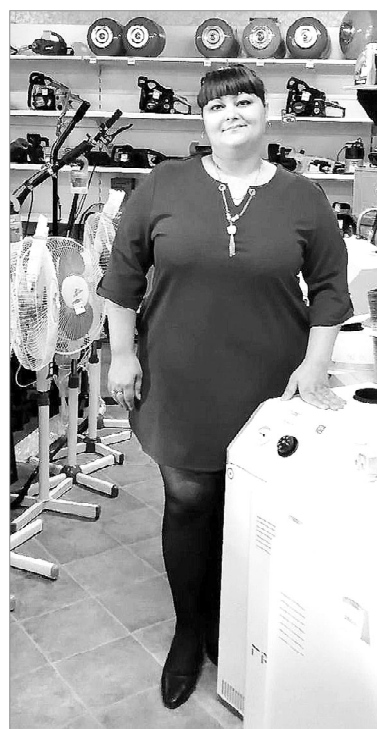
Жизнь не стоит на месте, и мы двигаемся вместе с ней.

— Ну, конечно! Если начинали с 800 тысяч рублей, то на сегодняшний день на остатке более 5 миллионов. К тому же, стараемся что-то привозить по заявкам. Одним словом — стремимся к тому, чтобы удовлетворять покупательские потребности.