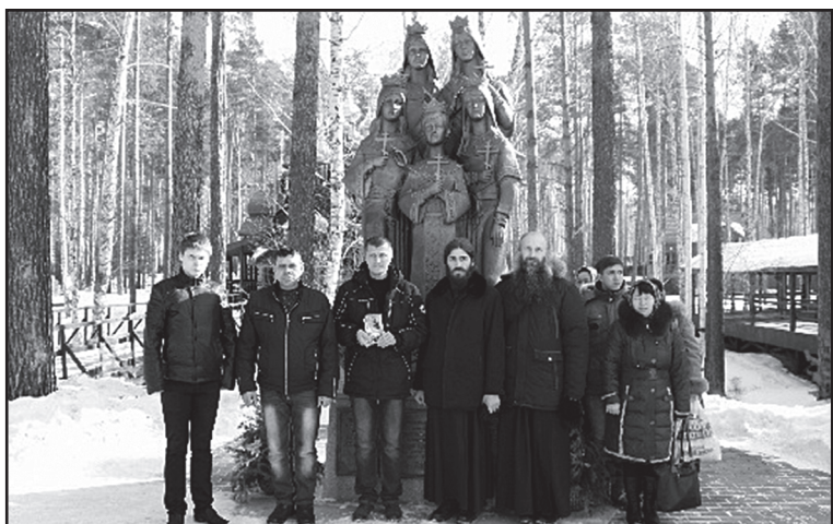
В монастыре святых Царственных Страстотерпцев в урочище Ганина яма