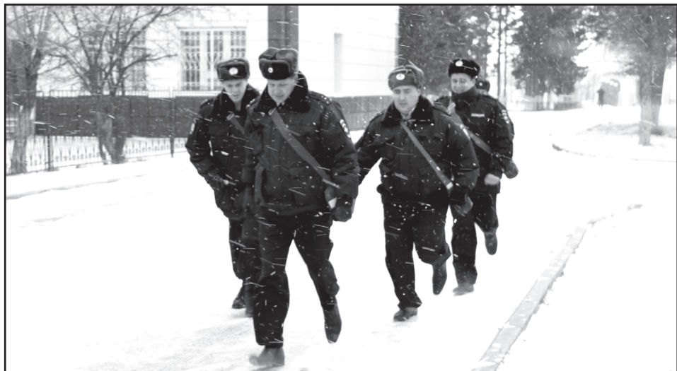
Учения в Юргинском