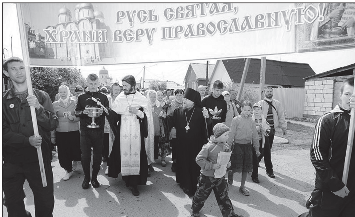
Крестный ход, г. Ишим

В связи с этим мне припомнилась такая расхожая притча: подростка, бегущего очертя голову, спрашивают: «Куда ты бежишь?». Он отвечает: «Почему все спрашивают, куда я бегу? Почему никто не спросит, откуда я бегу?».