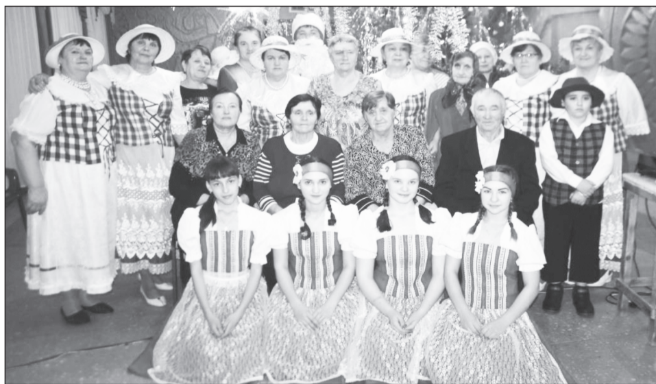
Семейный клуб – прочное звено моста дружбы и кладёшь традиций.

На территории Суерского поселения сейчас проживают 46 репрессированных немцев Поволжья и к трагической дате – Дню памяти жертв