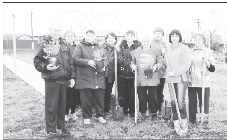
Прогулочные дорожки, скамейка примирения, стелла-фоторамка для молодожёнов и декоративные деревья – вся эта красота в центре села создаётся руками суерцев.

В рамках акции были заменены старые водозаборные скважины-срубы на более миниатюрные, не портящие общий вид современные колодцы. Зимой Нине Коноваловой вместе с коллеж-