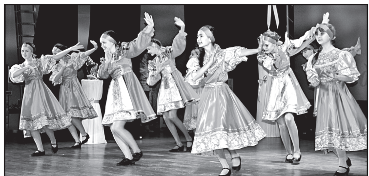
Поздравление от юных артистов

24 февраля – День образования Юргинского района