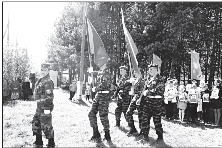
Традициям – крепнуть