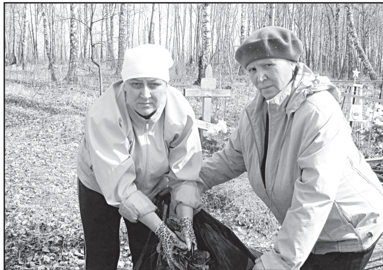
На уборке территории кладбища

счётчики, передающие информацию в энергосбытовую организацию. Следим за состоянием светоносителей: в Дегтярёвой восемь фонарей, в Некрасовой – три, в Шипаково – сорок пять. Вопросы освещения в системе решаем, практика отработана.