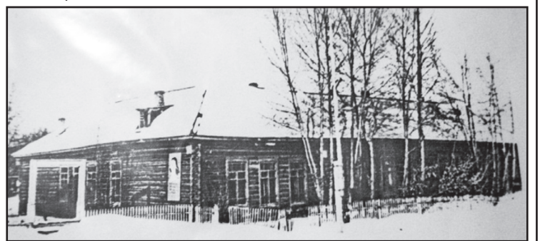
Старое здание Северо-Плетнёвской школы

О. АЛЕКСАНДРОВА Фото из архивов районного краеведческого музея и музея Северо-Плетнёвской СОШ