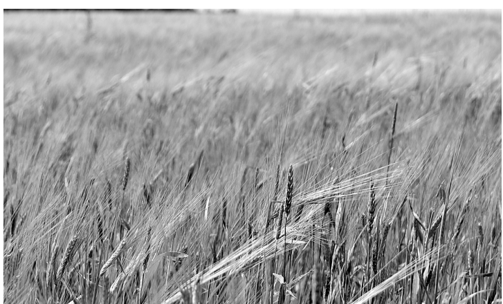
На полях колосится ячмень