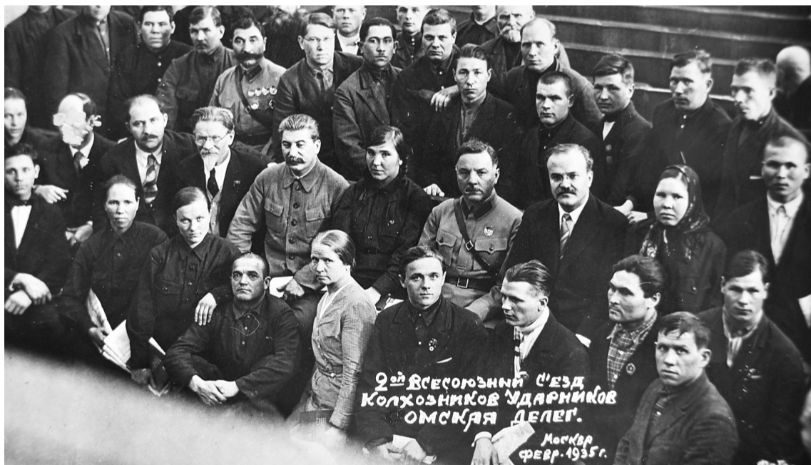
Второй всесоюзный съезд колхозников-ударников состоялся с 11 по 17 февраля 1935 года в Москве. В его работе участвовало 1433 делегата. Подавляющее большинство участников съезда являлись рядовыми колхозниками: полеводцами, конюхами, доярками, свинарками, телятницами, комбайнерами, трактористами, представителями других профессий. Сравнительно небольшая часть делегатов (менее четверти от общего числа) – председатели колхозов. На втором съезде с исторической речью об итогах коллективизации выступил Иосиф Сталин.