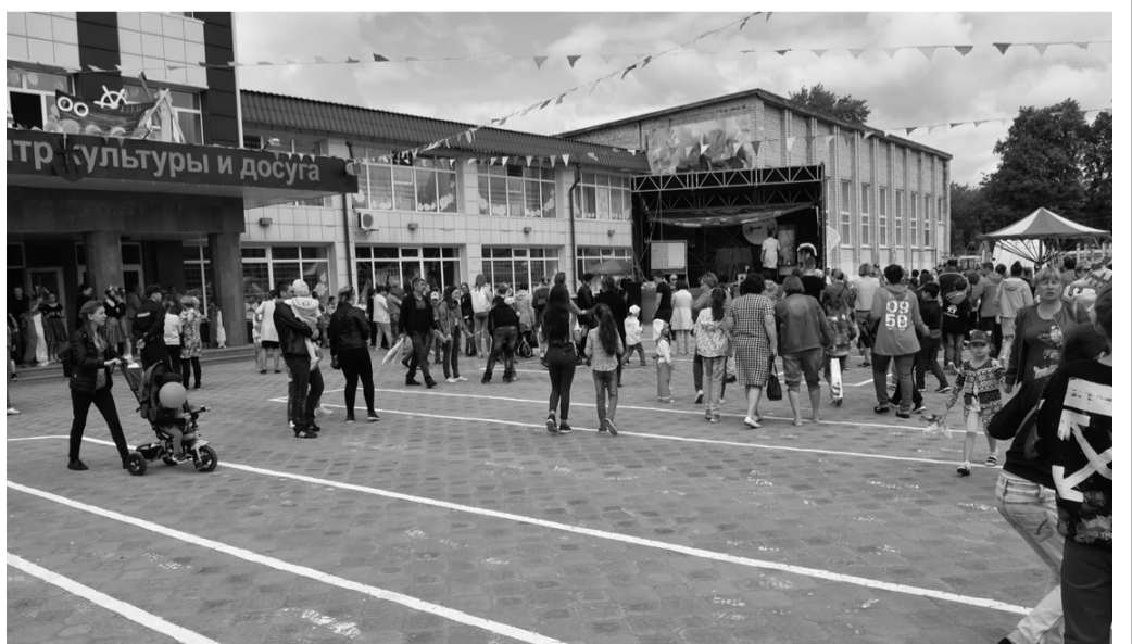
В Ярковском ЦКД ждут на праздник всех!

Помимо этого, с 18 часов также будут работать аттракционы, батуты, аквагрим, палатка здоровья, мастер-класс по росписи деревянных заготовок.