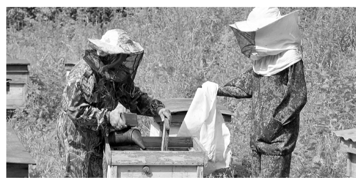
Пчеловоды трудятся круглый год.