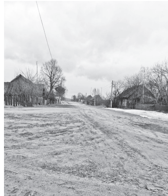
Опустевшие улицы населенных пунктов поселения

района». Соблюдается масочный режим. Фельдшерами, волонтерами и специалистами соцслужбы проводится обход одиноких граждан. Клубы и библиотеки не проводят массовых мероприятий, чтобы не создавать скопления людей.