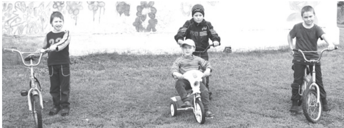
|| Команда мальчиков на старт!

Девочки соскучились по школе, одноклассникам, учительнице, но на следующее лето обязательно придут на спортивно-оздоровительную площадку в родной сельский клуб.