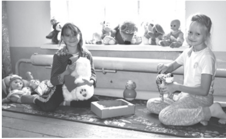
Девочки с любимыми игрушками.