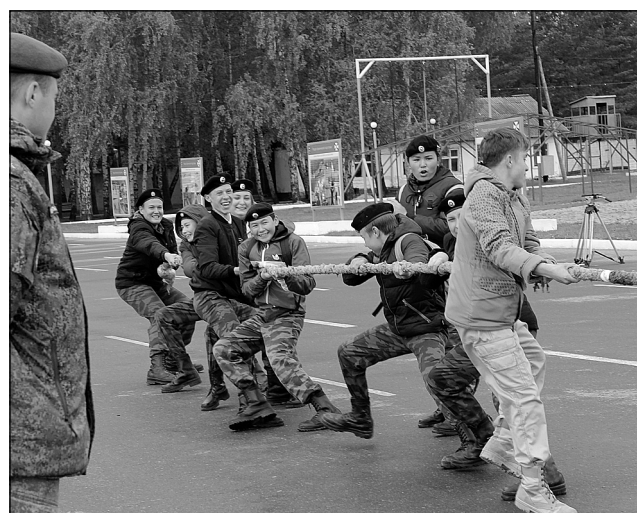
Кто перетянет канат?