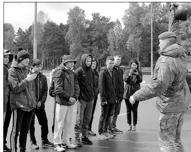
Делай, как я.