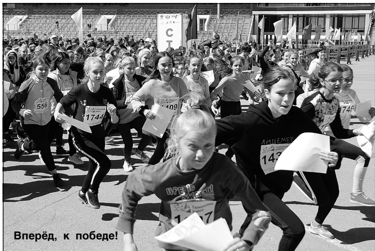
Вперёд, к победе!