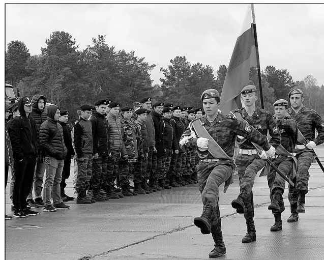
К выносу знамени подготовиться!