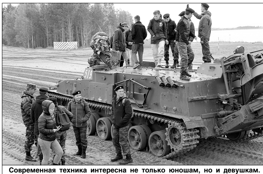
Современная техника интересна не только юношам, но и девушкам.

К тем, кто уже завтра отправится в войска, с добрыми словами напутствий обратились заместители