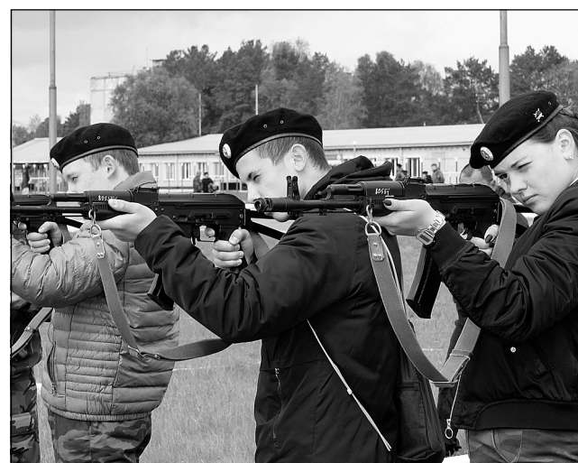
Точно в «яблочко»!