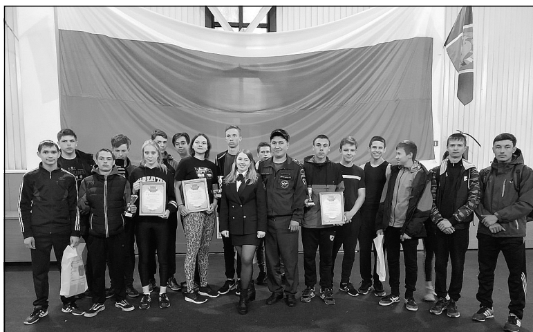
Фото МОНД и ПР № 9.

На снимках: третий этап районных соревнований юных пожарных.