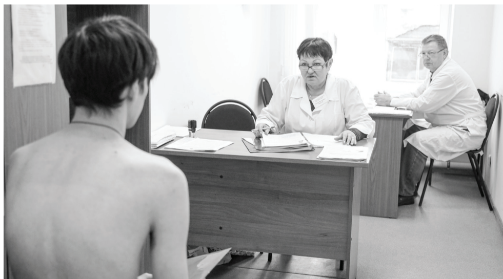
Главный критерий годности к военной службе — здоровье призывников.

— Ежегодно выполнять показатели по призыву и гарантировать высокое качество контингента нам помогает комплексная слаженная работа, в первую очередь сферы образования,