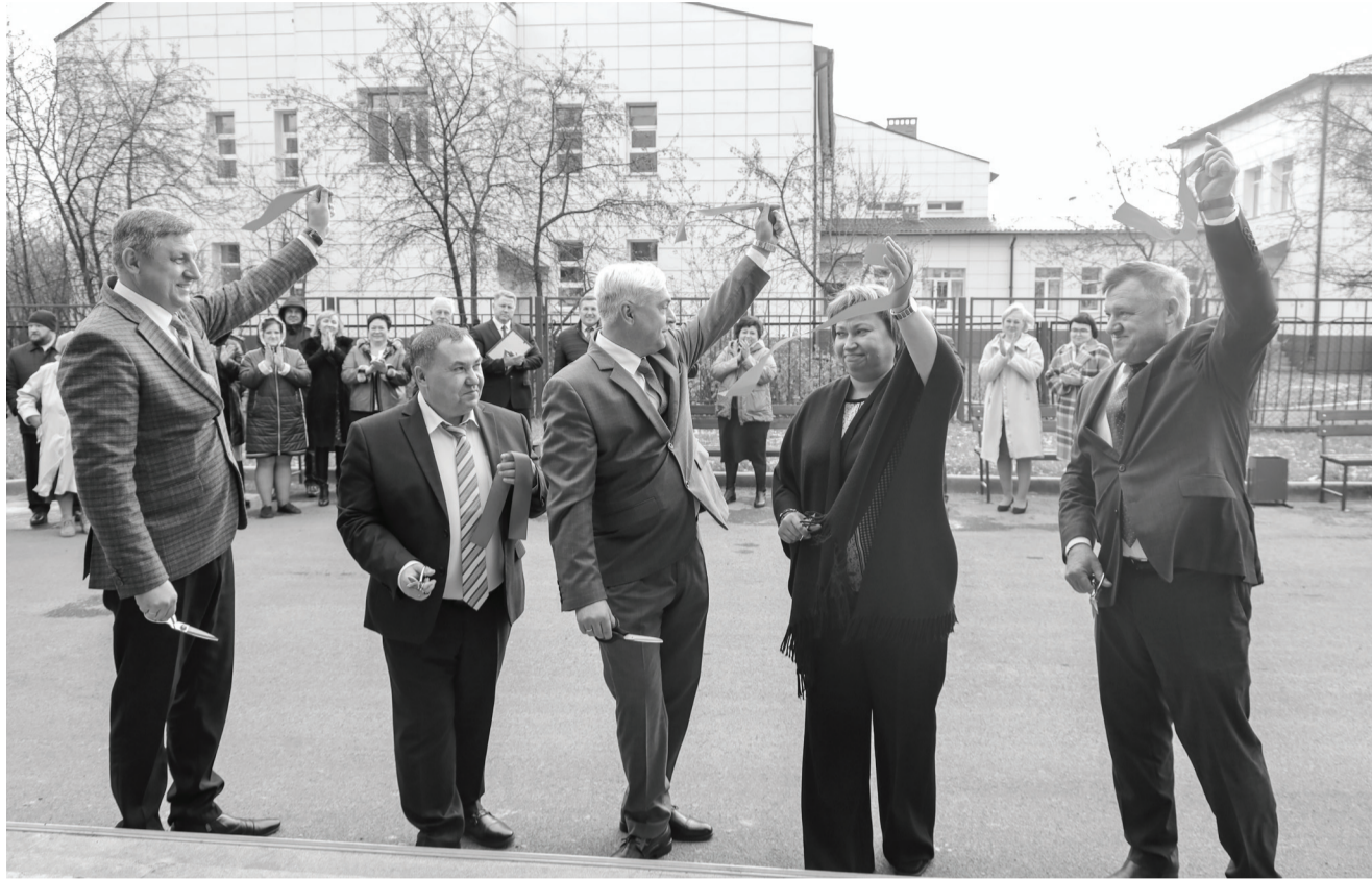
С 30 сентября 2022 года Ишимский городской и Ишимский районный суды функционируют по новому адресу: ул. Приозёрная, 84.

Пять лет назад было принято решение — передать для размещения судов здание на ул. Приозёрной, 84.