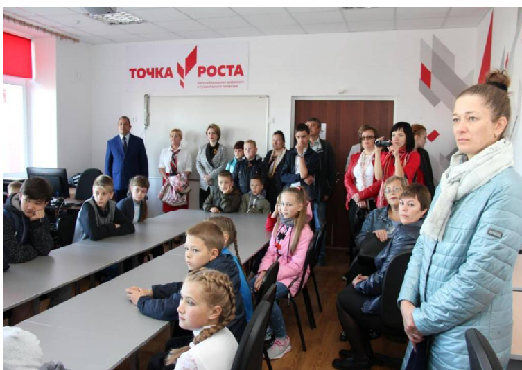
На экскурсии по центру // Фото Татьяны СУХОВОЙ.

• 27 сентября – День воспитателя и всех дошкольных работников