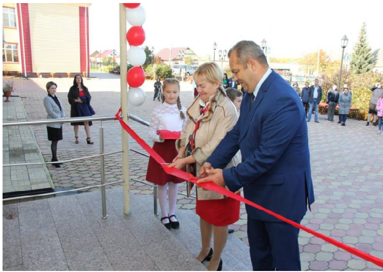
Торжественное открытие центра.

Сначала воспользоваться услугами «Точки роста» смогут только обучающиеся ВСОШ №2, но со временем, во втором полугодии этого