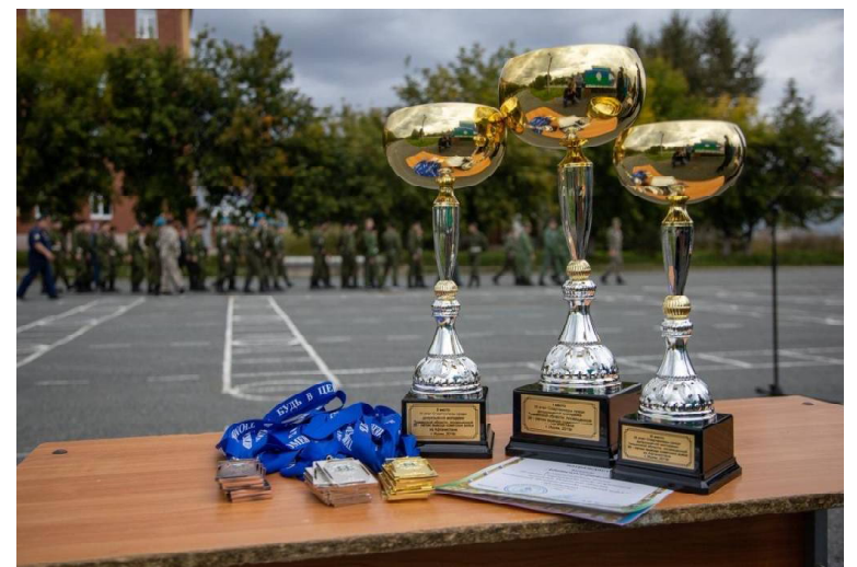
➤ Награды – победителям