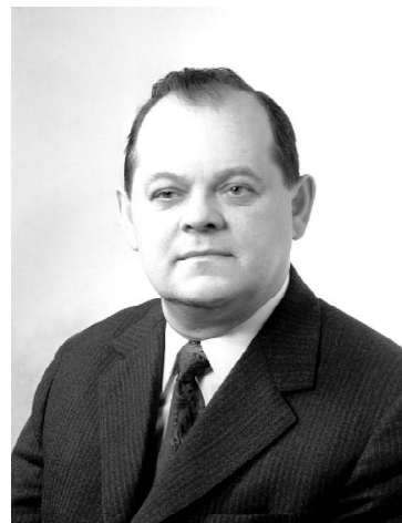
➤ Борис Щербина.

6 октября 2019 года в 11.00 в Тюменской областной научной библиотеке имени Дмитрия Менделеева состоится презентация книги «Слово о Борисе Щербине», приуроченная к 100-летию годовщины со дня рождения государственного и партийного деятеля СССР, Героя Социалистического Труда Бориса Евдокимовича Щербины.