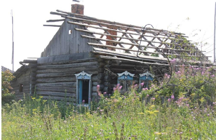
➤ Таких заброшенных участков в нашем районе немало